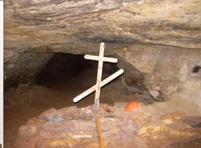
Могила «белого спелиолога»