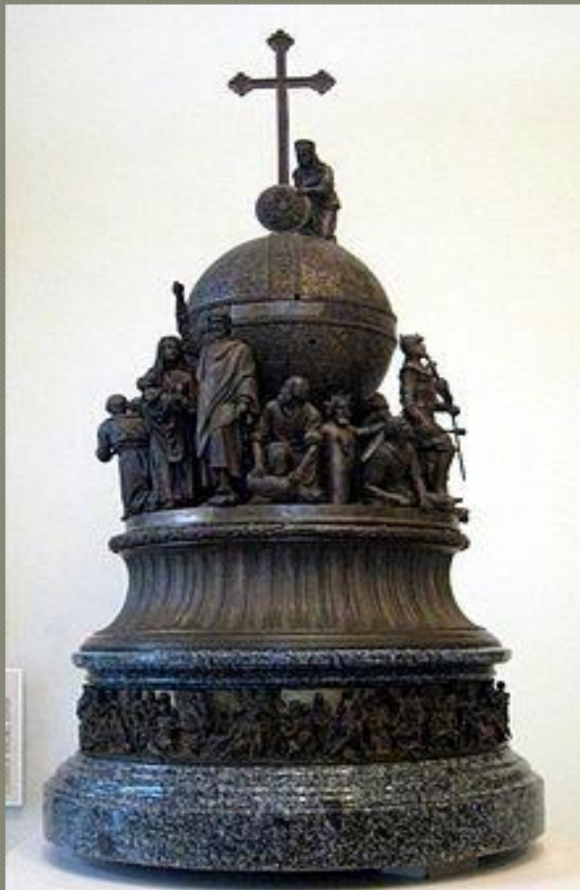
Один из ранних макетов памятника

В 1857 году Кабинет министров вынес постановление о сооружении памятника в Новгороде, с этой целью был объявлен сбор пожертвований от граждан всех сословий. Бюджет оценивался примерно в полмиллиона рублей, удалось собрать 150 тысяч, остальную сумму внесло государство. В мае 1859 года был объявлен конкурс на создание проекта памятника, и к сроку их предоставили 53. Из них и был выбран проект Микешина, как наиболее соответствующий замыслу правительства. Скульптору предстояло составить список выдающихся русских деятелей с древнейших времён до середины XIX века, фигуры которых будут установлены на памятнике.