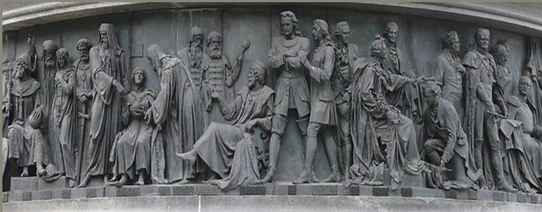
«Государственные люди» (26 фигур)