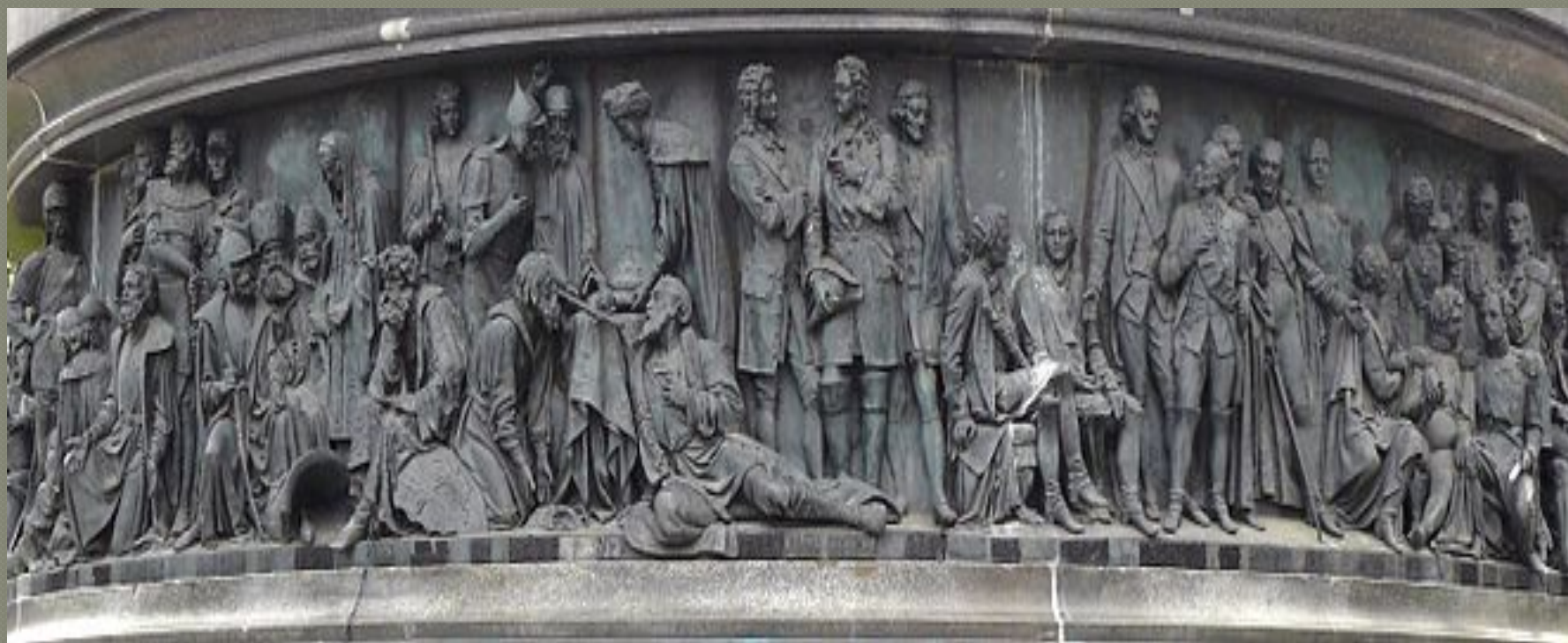
«Военные люди и герои» (36 фигур)