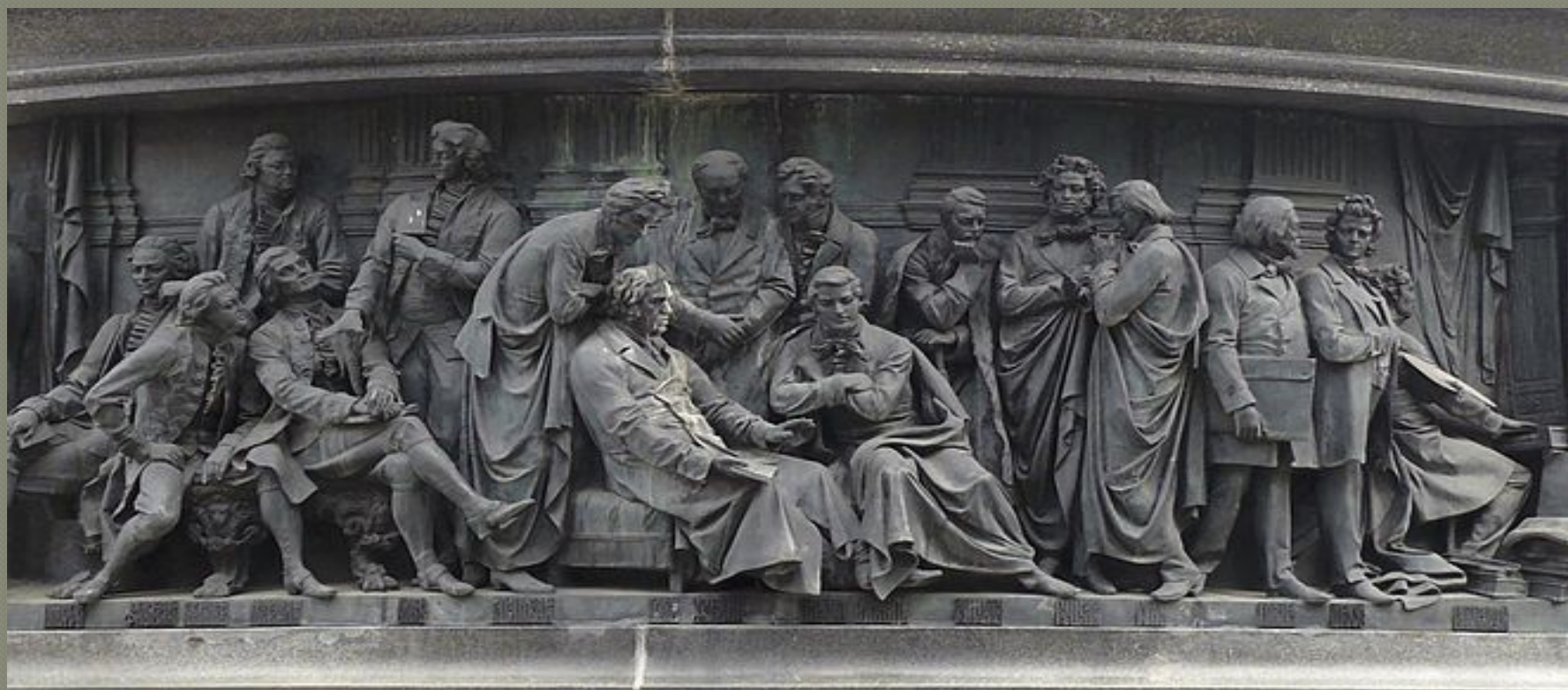
«Писатели и художники» (16 фигур)