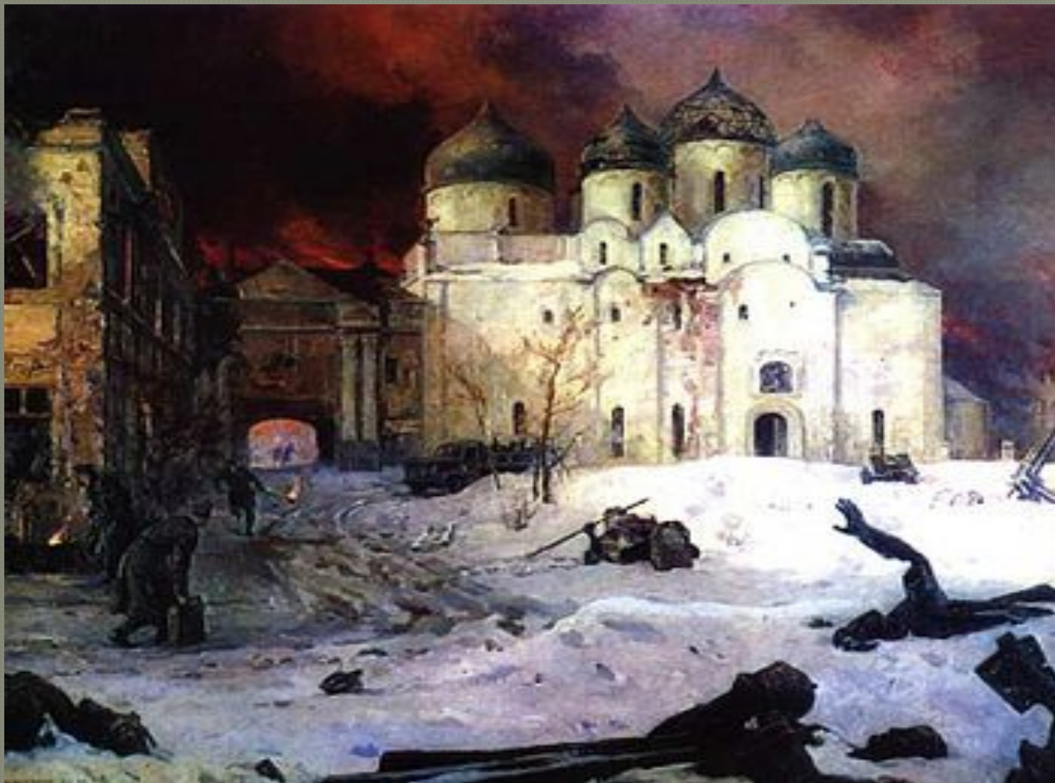
Кукрыниксы, картина «Бегство фашистов из Новгорода», 1944—1946. На переднем плане фрагменты разбитой скульптуры, похожие на убитых людей.