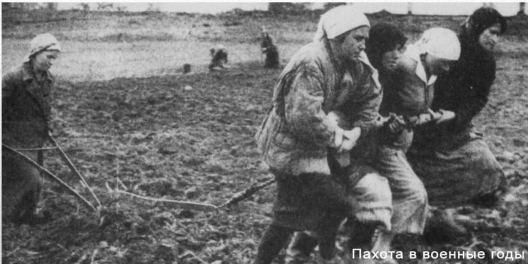
Пахота в военные годы

Под лозунгом «Все для фронта, все для победы!» трудились все коллективы советского тыла. Ушедших на фронт мужчин заменили женщины и подростки.