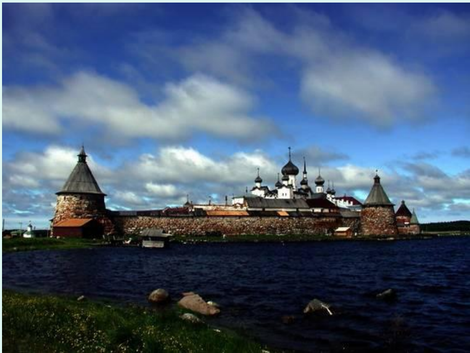
Общий вид со стороны Белого моря