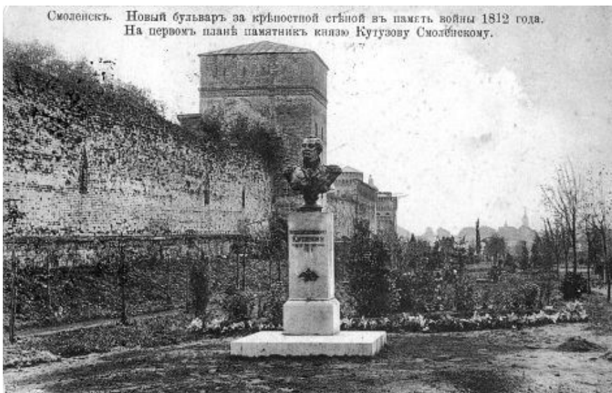
Смоленскъ. Новый бульваръ за крѣпостной стѣной въ память войны 1812 года. На первомъ планѣ памятникъ князю Кутузову Смоленскому.

В столетний юбилей был также установлен бюст героя Отечественной войны главнокомандующего М. И. Кутузова. Он был создан на средства, собранные среди населения Смоленской губернии. Автор проекта – скульптор Мария Страховская.