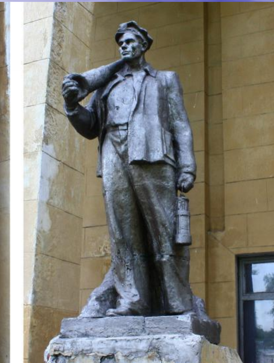
Памятник мужчине горняку