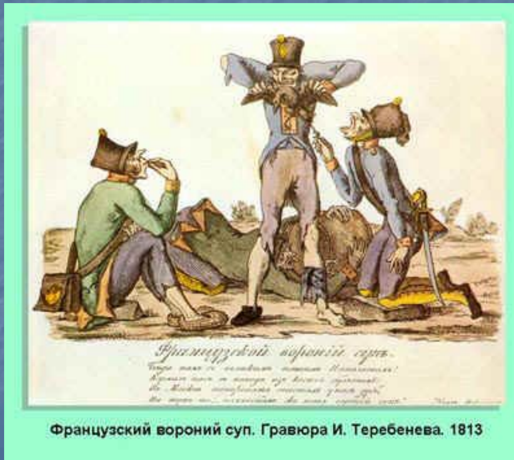
Французский вороний суп. Гравюра И. Тербенева. 1813