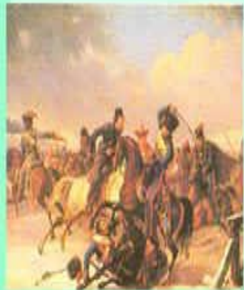
«Преследование казаками отступающих французов».