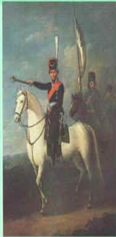
Платов Матвей Иванович (1751-1818)

Началось замешательство во французских войсках. А тем временем войска Платова открыли огонь. Французы бросили обозы и артиллерию и, боясь быть окруженными, начали переправу вброд. Однако часть казаков переправилась на другую сторону реки и начала теснить неприятеля с другой стороны. Корпус Богарне был в панике и нес огромные потери. Богарне потерял более 2000 человек убитыми и 3500 ранеными, 87 пушек. Но генерал М. И. Платов, несмотря на свою победу, преследовал остатки корпуса и взял в плен еще более 100 человек, тем самым он лишил вице-короля Италии боеспособности.