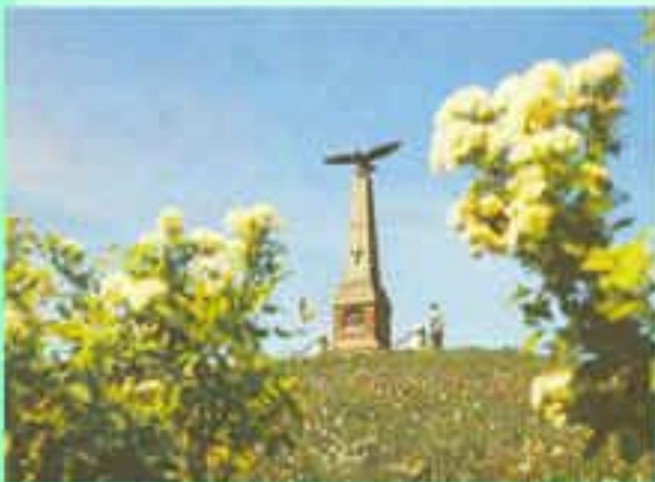
Памятник М. И Кутузову .