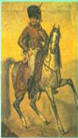
Богарне Евгений-Наполеон (1781-1824)