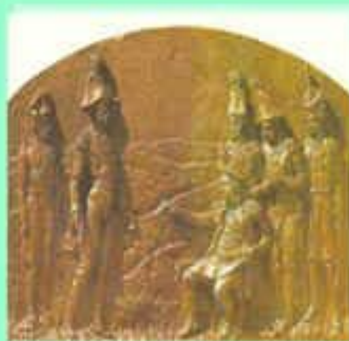
Барельеф на памятнике М. И. Кутузову в Горках.