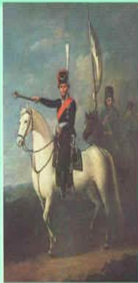
Платов Матвей Иванович (1751-1818)

Началось замешательство во французских войсках. А тем временем войска Платова открыли огонь. Французы бросили обозы и артиллерию и, боясь быть окруженными, начали переправу вброд. Однако часть казаков переправилась на другую сторону реки и начала теснить неприятеля с другой стороны. Корпус Богарне был в панике и нес огромные потери. Богарне потерял более 2000 человек убитыми и 3500 ранеными, 87 пушек. Но генерал М. И. Платов, несмотря на свою победу, преследовал остатки корпуса и взял в плен еще более 100 человек, тем самым он лишил вице-короля Италии боеспособности.