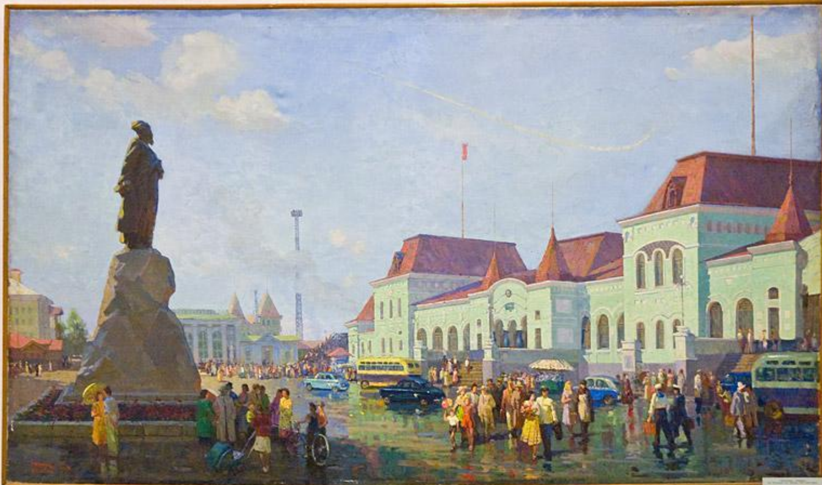
Картина из фонда музея Хабаровского краеведческого музея Гродекова