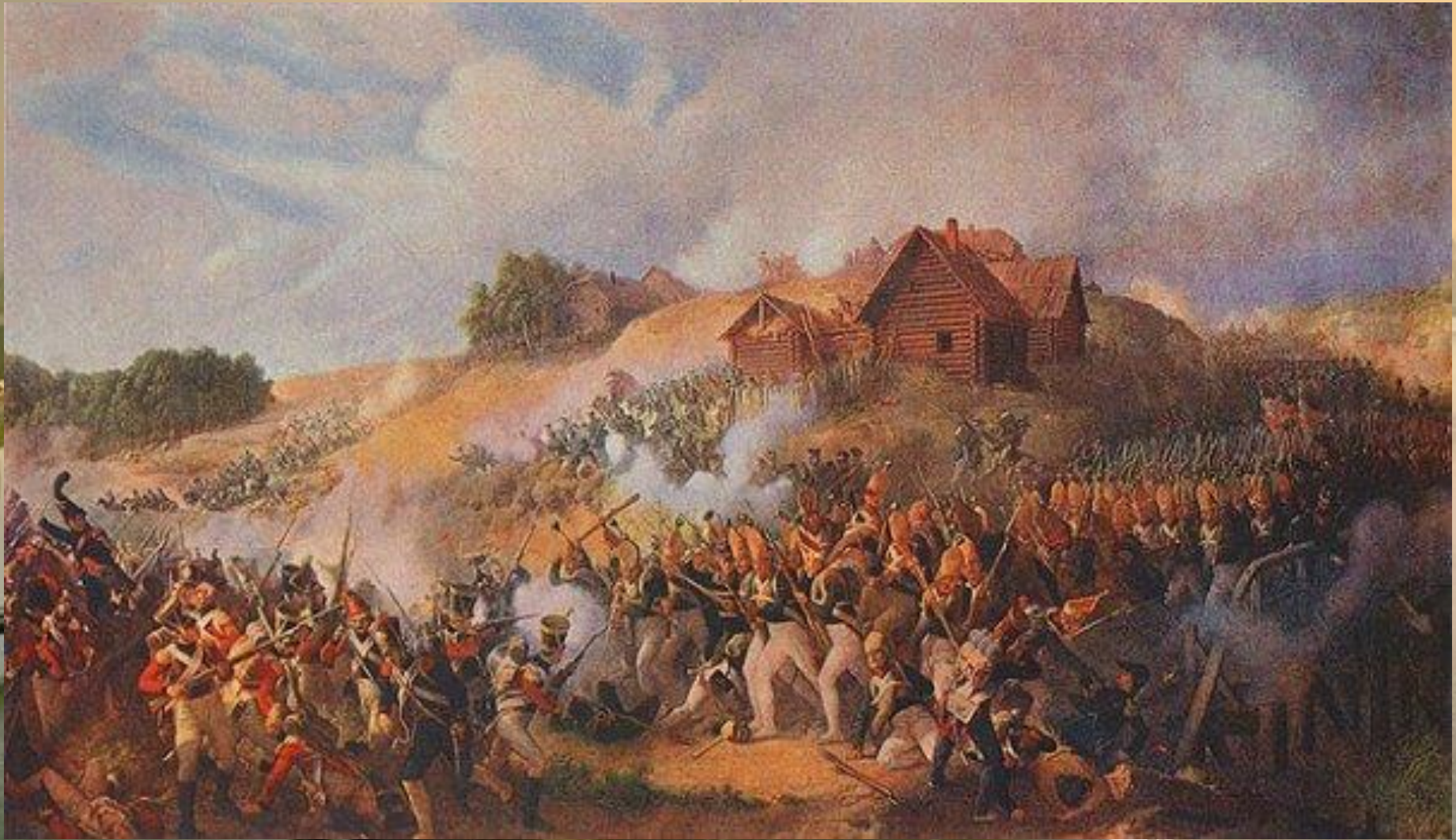
Фото П.Гесс Сражение при Клястицах 19 июля 1812 года