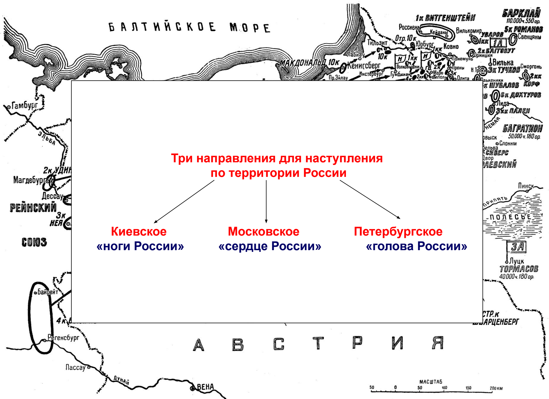
Схема 34. Начало похода Наполеона в Россию в 1812 г.