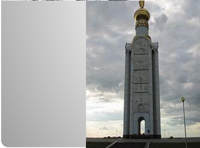
Звонница в память о погибших на Прохоровском поле

Курская битва ( 5 июля 1943 — 23 августа 1943 ), также известна как Битва на Курской дуге , Операция «Цитадель» своему размаху, привлекаемым силам и средствам, напряжённости, результатам и военно-политическим последствиям, является одним из ключевых сражений Великой Отечественной войны. Курская битва продолжалась сорок девять дней — с 5 июля по 23 августа 1943 г. 12 июля в районе Прохоровки произошел крупнейший в истории встречный танковый бой. Победа под Курском ознаменовала переход стратегической инициативы к Красной Армии.