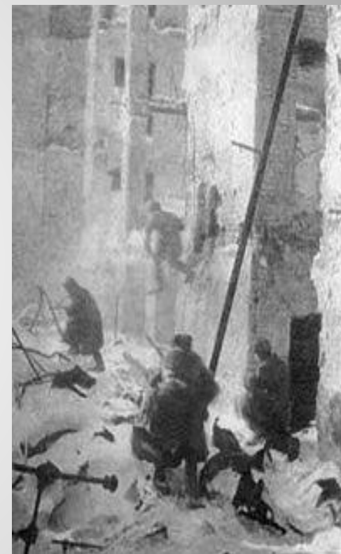
Уличные бои в Сталинграде.

Победоносный исход Сталинградской битвы имел огромное военно-политическое значение. Она внесла решающий вклад в достижение коренного перелома не только в Великой Отечественной войне, но и во всей Второй мировой войне, явилась важнейшим этапом на пути к победе над фашистским блоком. Были созданы условия для развертывания общего наступления Красной Армии и массового изгнания немецко-фашистских захватчиков с оккупированных территорий Советского Союза. В результате Сталинградской битвы советские Вооруженные Силы вырвали у противника стратегическую инициативу и удерживали ее до конца войны. Победа под Сталинградом еще выше подняла международный авторитет Советского Союза и его Вооруженных сил.