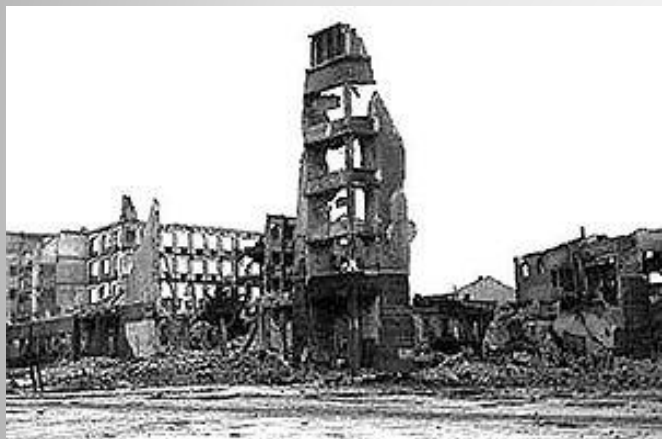
Руины Сталинграда 1943 г.

Сталинградская битва была одним из важнейших событий Второй мировой войны. Она продолжалась 200 суток. Сражение включало в себя попытку вермахта захватить левобережье Волги в районе Сталинграда (современный Волгоград) и сам город, противостояние в городе, и контрнаступление Красной армии (операция «Уран»), в результате которого VI армия вермахта и другие силы союзников Германии внутри и вокруг города были окружены и частью уничтожены, частью захвачены в плен. По приблизительным подсчётам, суммарные потери обеих сторон в этом сражении превышают два миллиона человек.