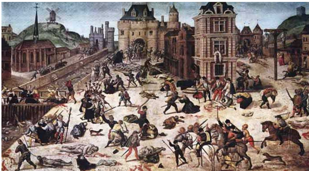
Варфоломеевская ночь. Художник Франсуа Дюбуа.