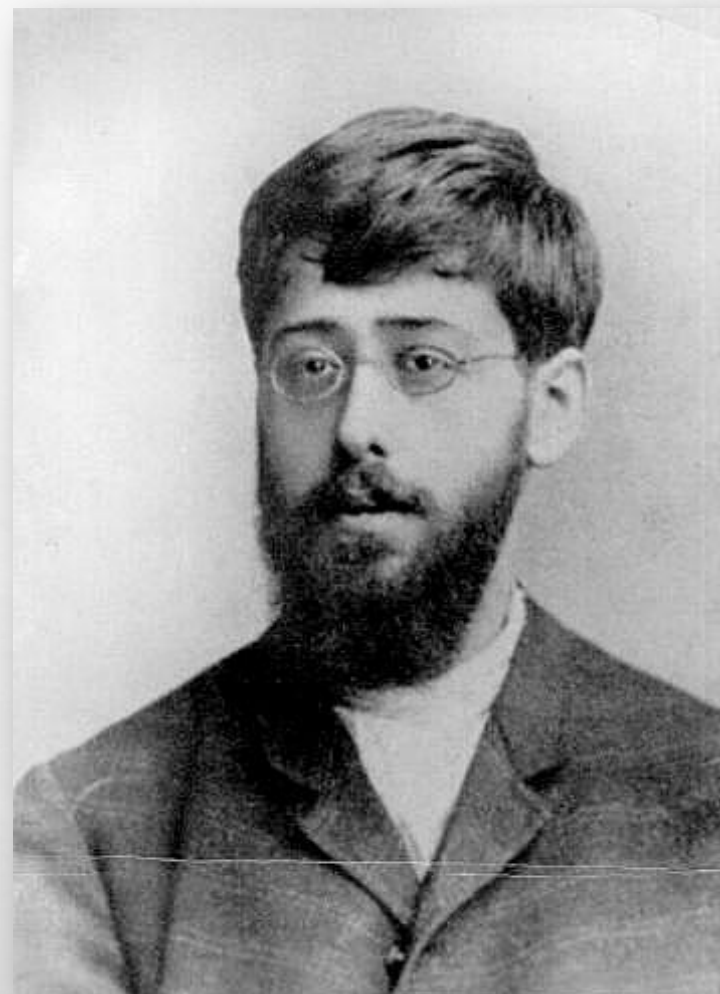
Лидер меньшевиков Ю. О. Мартов