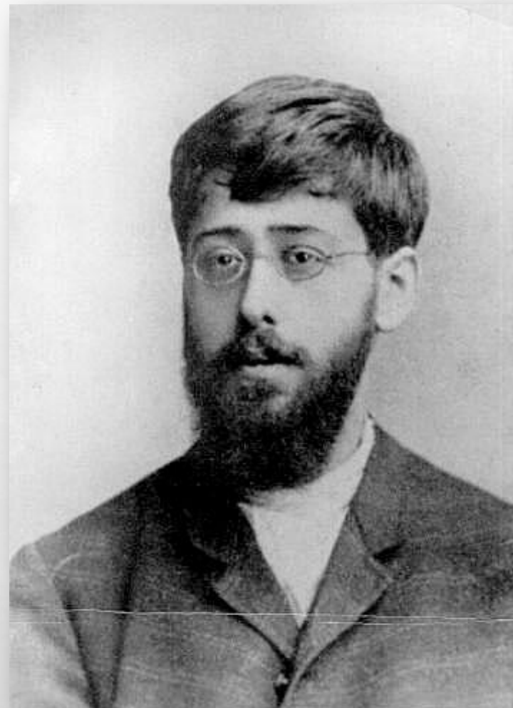
Лидер меньшевиков Ю. О. Мартов