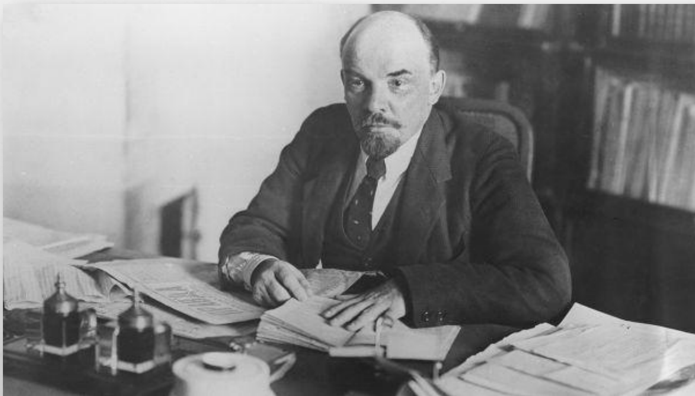
Лидер большевиков В. И. Ленин