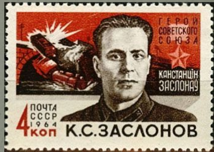
Рельсовая война на почтовой марке СССР посвящённая К. С. Заслонову

Третий этап «рельсовой войны», в ходе которой были полностью выведены из строя наиболее важные железнодорожные пути, частично парализованы перевозки врага по всем дорогам.