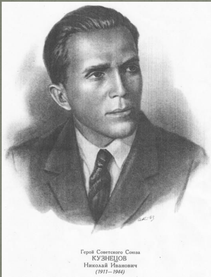
Герой Советского Союза КУЗНЕЦОВ Николай Иванович (1911—1944)

Кузнецов Николай Иванович-партизан, советский разведчик. Выдавая себя за немецкого офицера в г. Ровно, добывал ценную информацию.