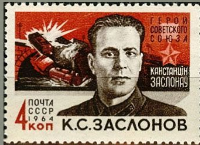
Рельсовая война на почтовой марке СССР посвящённая К. С. Заслонову

Третий этап «рельсовой войны», в ходе которой были полностью выведены из строя наиболее важные железнодорожные пути, частично парализованы перевозки врага по всем дорогам.