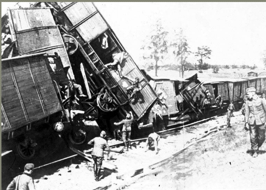
Крушение немецкого военного эшелона, организованного одним из отрядов партизан

По своим масштабам «Рельсовая война» приобрела стратегический характер. Начатая в ночь на 3 августа 1943 года в разгар ожесточенного сражения на Курской дуге, она развернулась на огромном пространстве протяженностью по фронту на 1000 км и в глубину 750 км, и продолжалась до середины сентября 1943 года. В операции приняли участие около 100 тысяч бойцов партизанских формирований и десятки тысяч человек мирного населения.