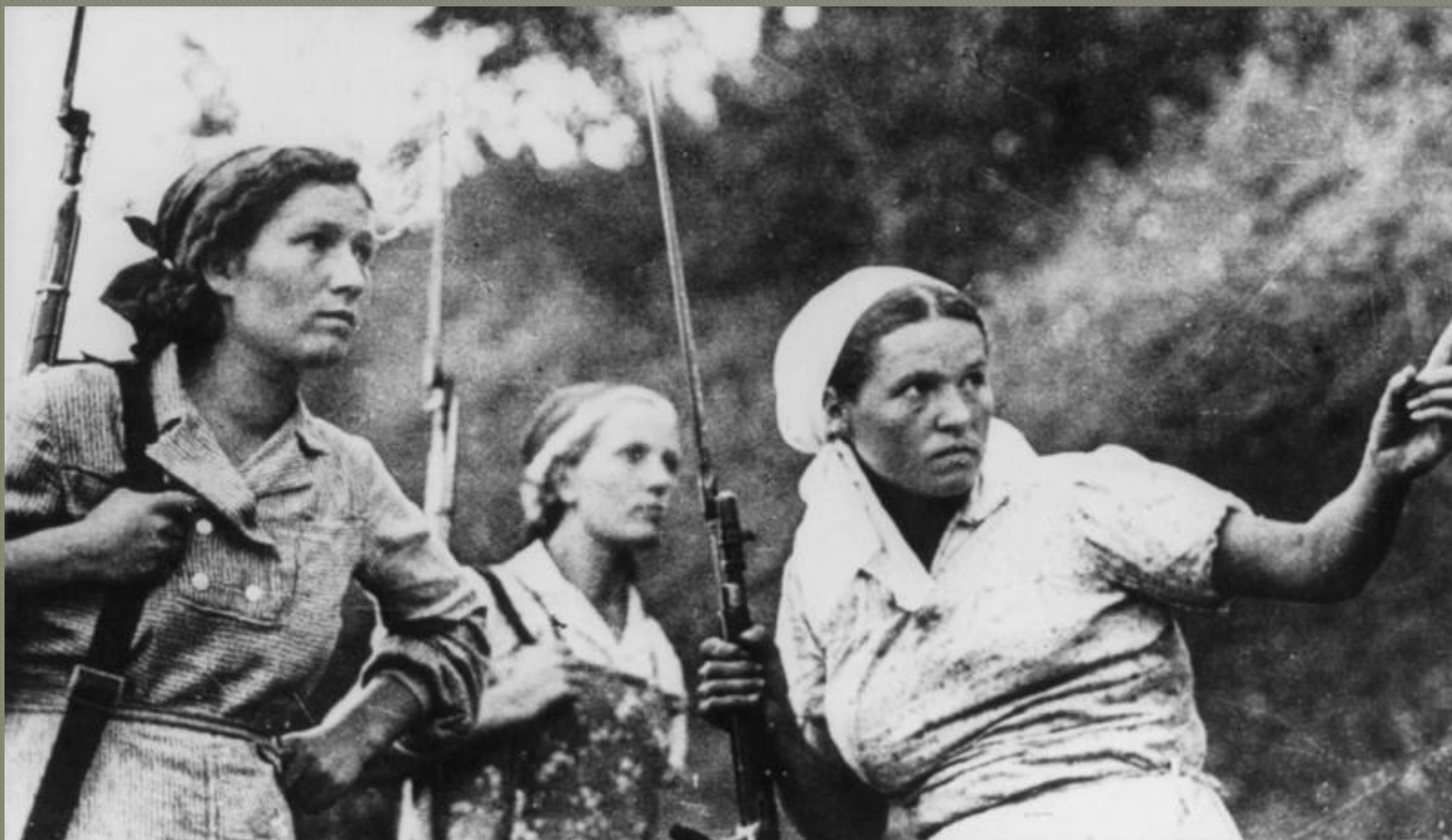
Советские женщины-партизанки, вооруженные винтовками Мосина с примкнутыми штыками.

на вооруженных партизанских отрядов преобладало легкое стрелковое оружие, автоматы, пулеметы и минометы.