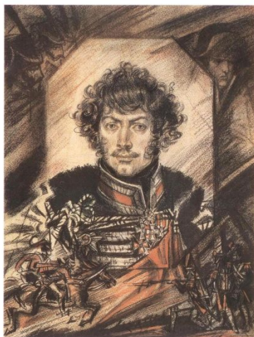
Александр Никитич Сеславин