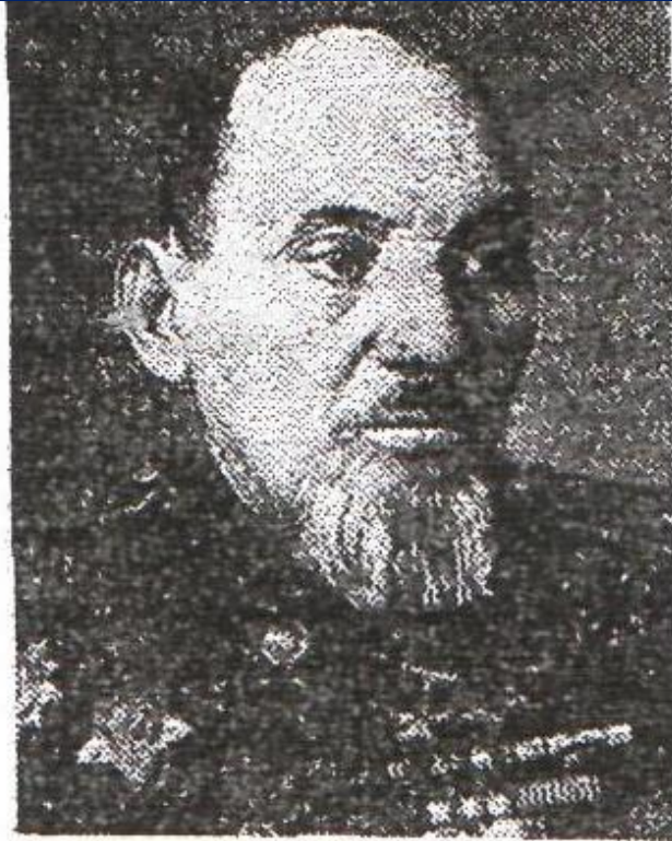
С. А. Ковпак.