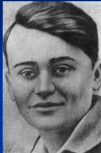
Молодогвардеец Олег Кошевой.