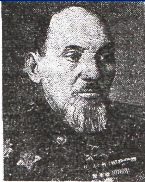
С. А. Ковпак.