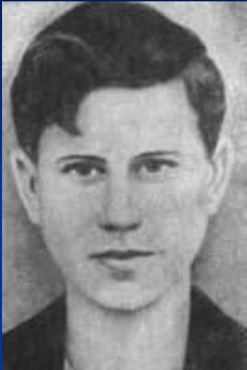
Молодогвардеец Сергей Тюленин.