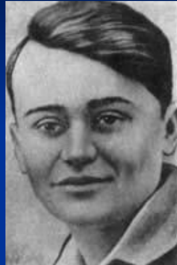
Молодогвардеец Олег Кошевой.