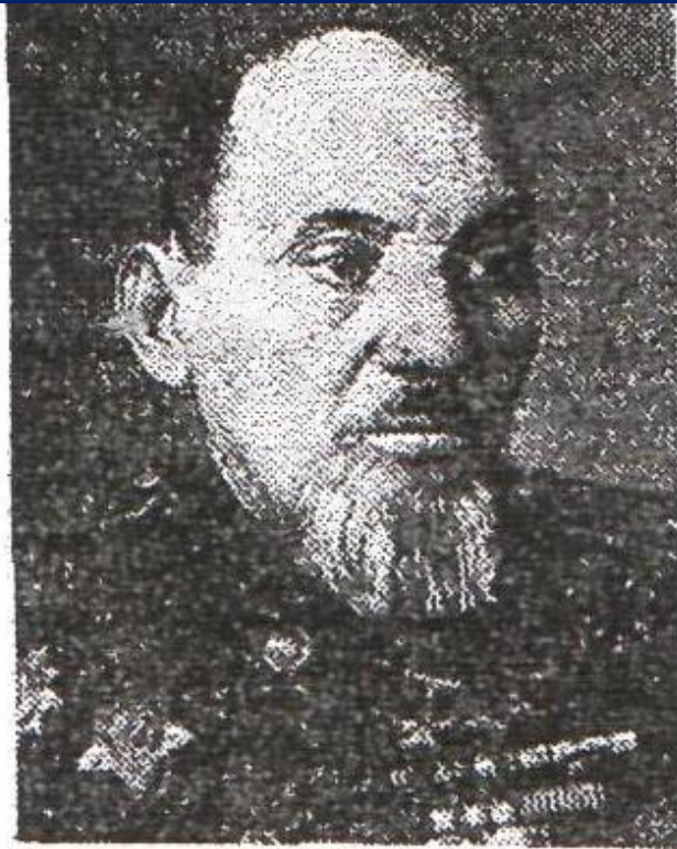
С. А. Ковпак.