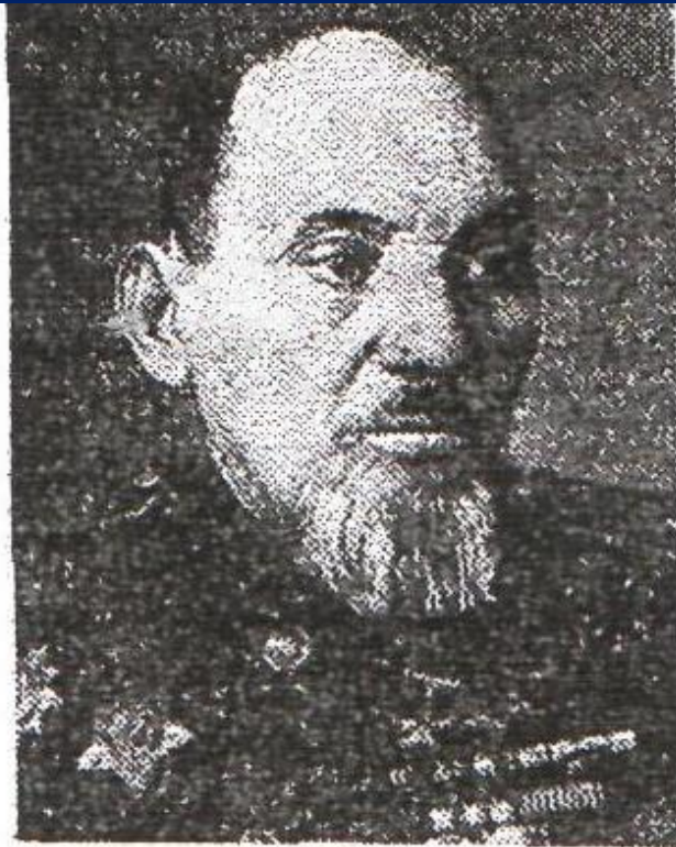
С. А. Ковпак.