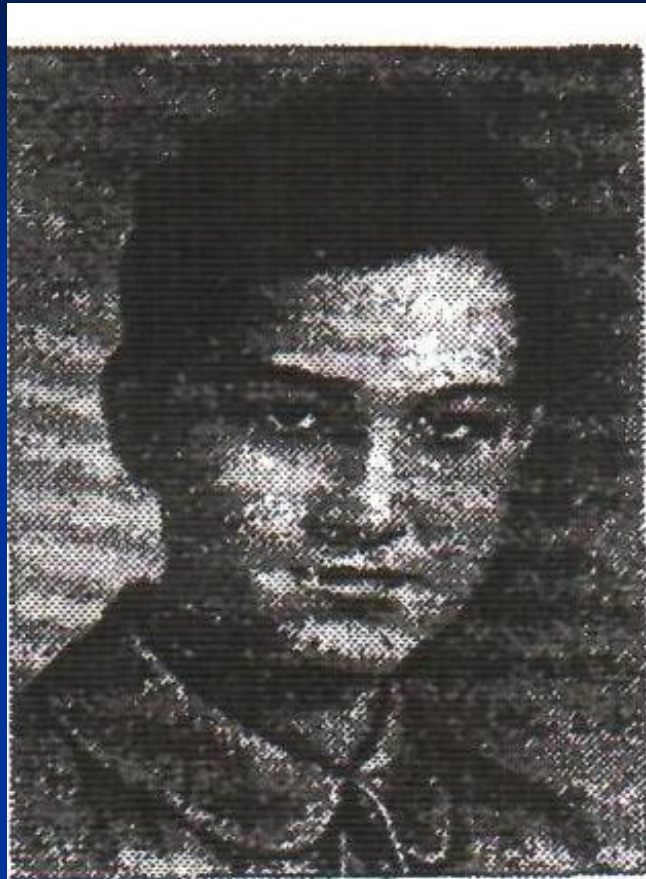
З. А. Космодемьянская.