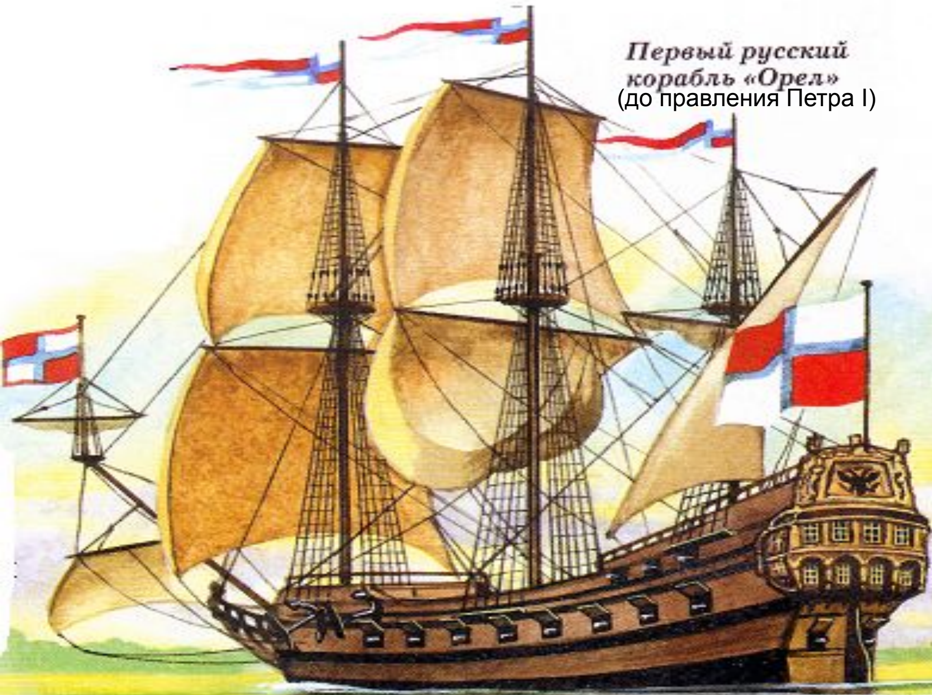
Первый русский корабль «Орел» (до правления Петра I)