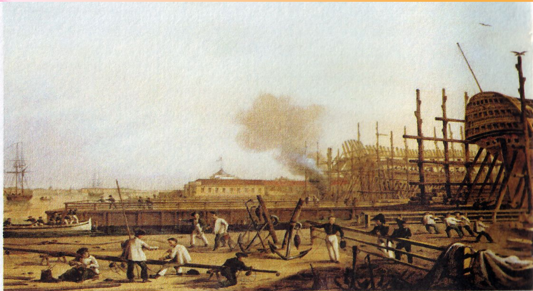
К. Беггров. «Адмиралтейская верфь»

В годы Северной войны со Швецией в России были построены около 10 верфей вблизи Балтики