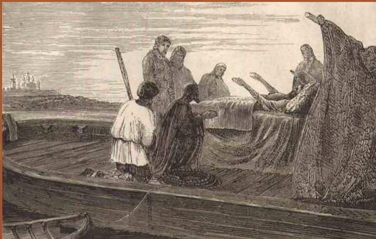
Смерть патриарха Никона (гравюра, 1870-е годы)

В 1681 году Никону разрешили переехать в Вознесенский Новоиерусалимский монастырь. Однако престарелый Никон умер в дороге близ Ярославля 17 августа 1681года.