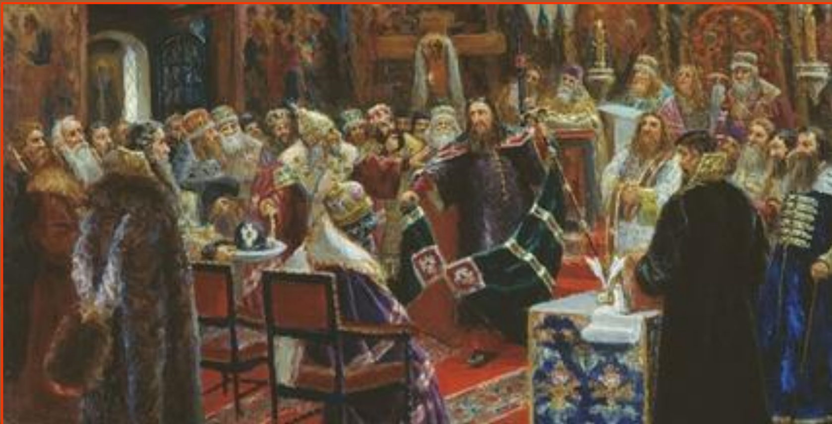
Суд над патриархом Никоном (С. Д. Милорадович, 1885 год)

Собор 1666 года одобрил реформы Никона, но он сам был отправлен в ссылку в Белозёрский Ферапонтов монастырь простым монахом