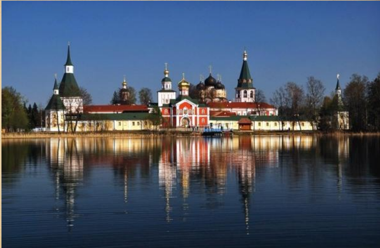
Иверский Святоозерский монастырь на Валдае

Первосвятитель всячески поощрял церковное строительство, сам он был одним из лучших зодчих своего времени. При Патриархе Никоне были сооружены богатейшие монастыри Православной Руси: