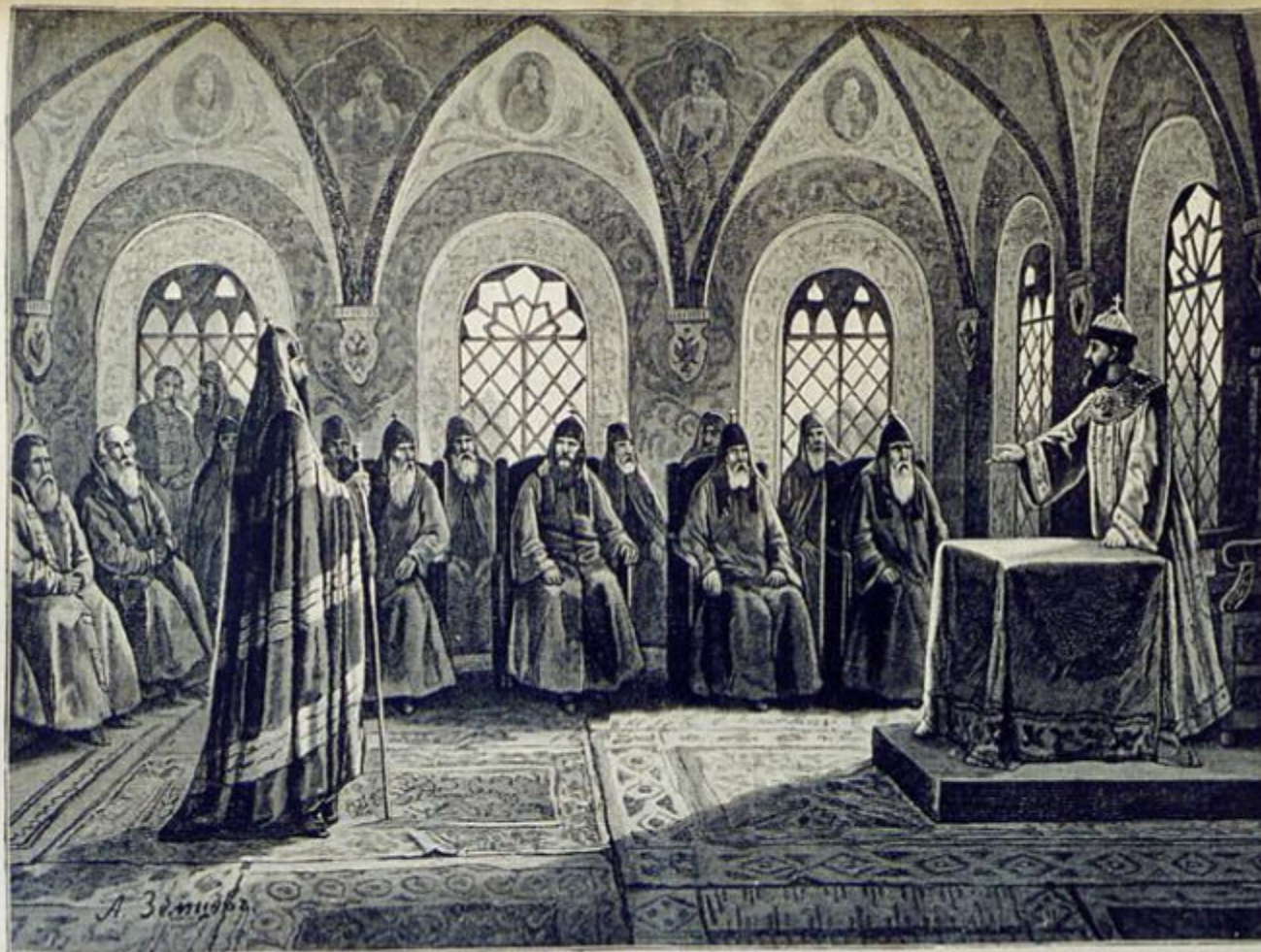
Русская история. Судъ надъ патриархомъ Никономъ. Ориг. рис. (собств. „Яквы“) А. Земцова, грав. Шоблеръ.