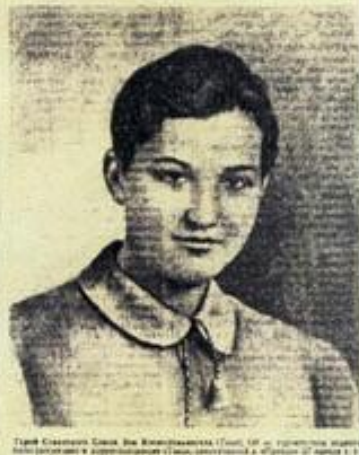
Герой Советского Союза Зоя Александровна Космодемьянская. 17 лет от роду вступила в партизанский отряд, уничтожила в тылу врага 10 танков, 20 автомашин, 50 лошадей, 100 голов скота, 300 пачек боеприпасов, 25 вагонов с боеприпасами, 25 вагонов с продовольствием, 10 вагонов с фуражом, 10 вагонов с одеждой, 10 вагонов с обувью, 10 вагонов с инструментами, 10 вагонов с другими вещами.