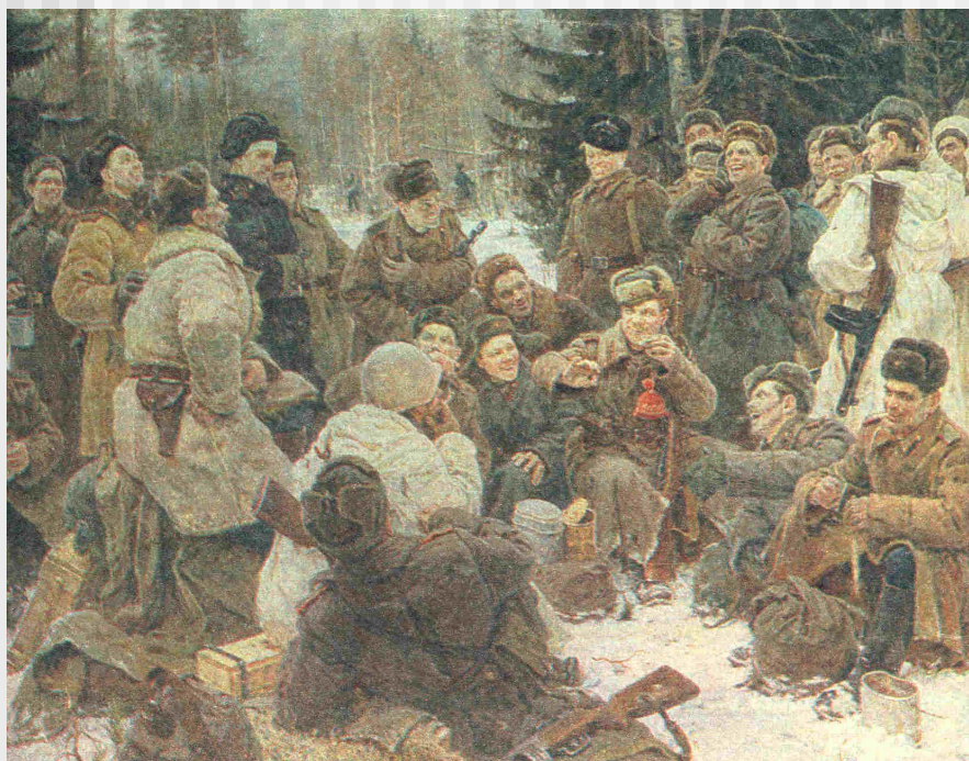
Ю. Непринцев «Отдых после боя».