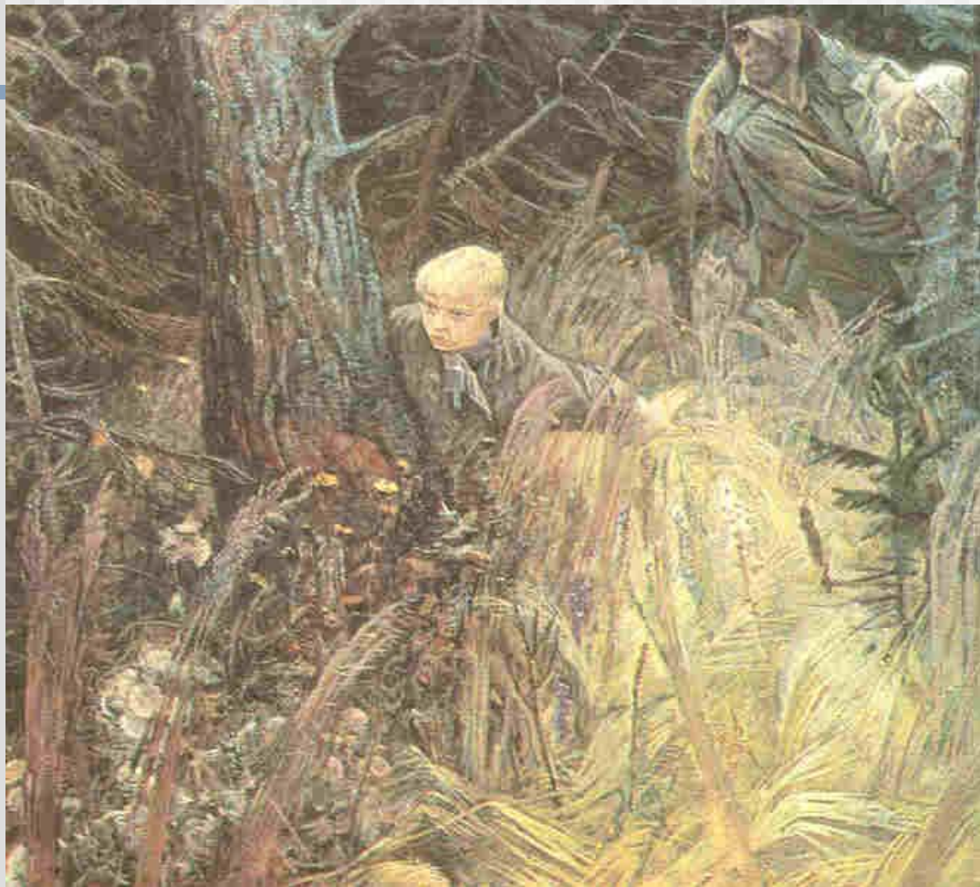
Н.И. Обрыньба «Первый подвиг»