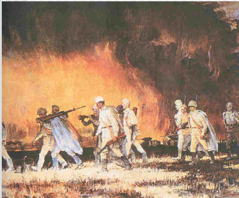
Ю.Непринцев «Вот солдаты идут»