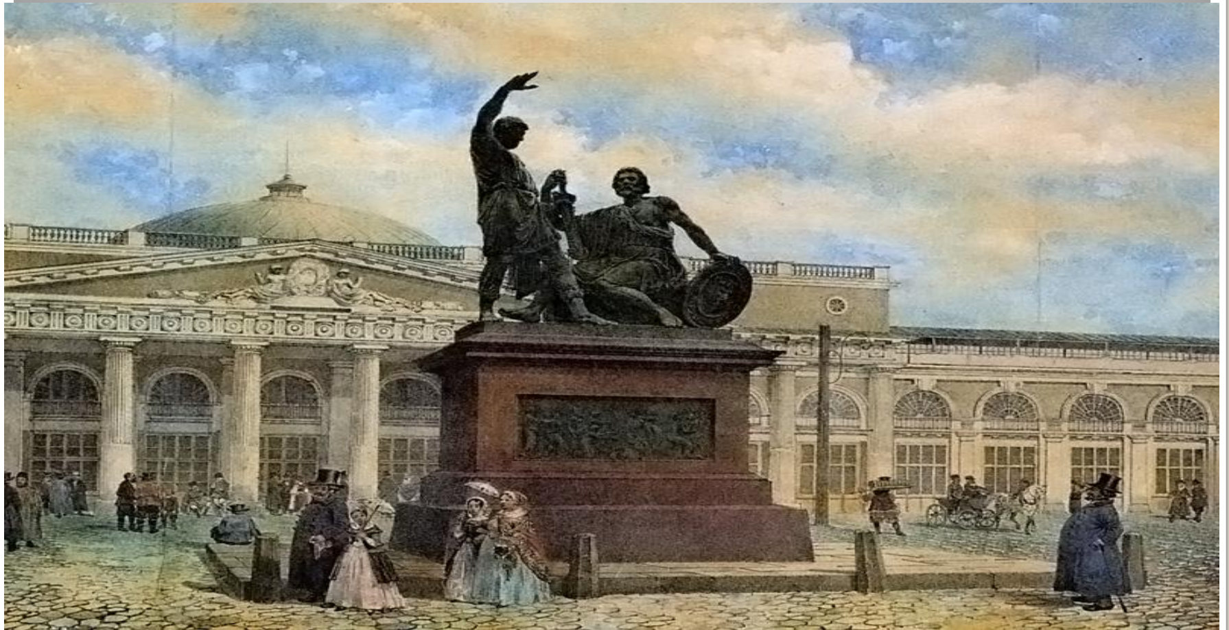
Памятник Кузьме Минину и Дмитрию Пожарскому в Москве.