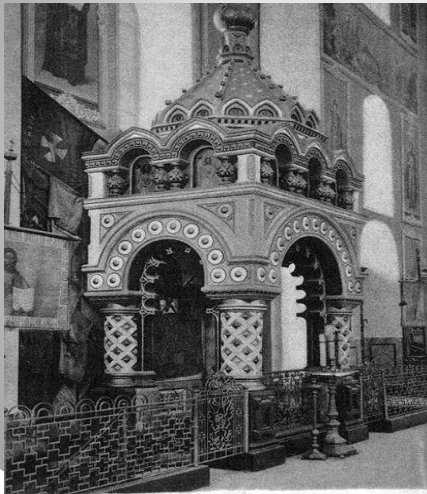
Гробница Д.Пожарского в Спасо-Евфимиевом монастыре (г.Суздаль)