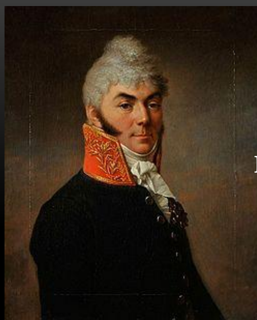
Н. Н. Новосильцев Президент академии наук