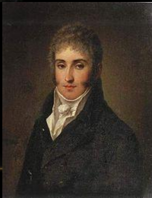
А. Чарторыйский Министр иностраннных дел