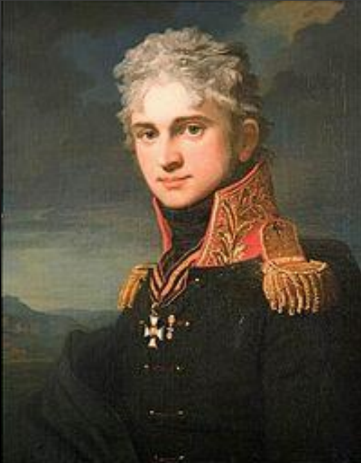
П. А. Строганов Тов. Министра внутренних дел