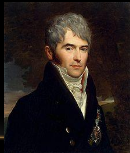
В. П. Кочубей Министр внутренних дел