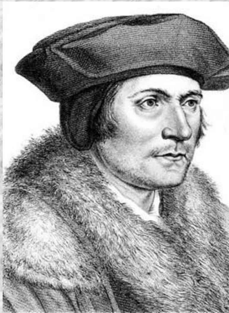
Томас Мор (1478–1535)