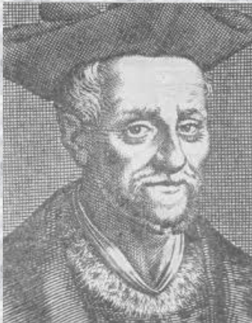
Франсуа Рабле (1494–1553)