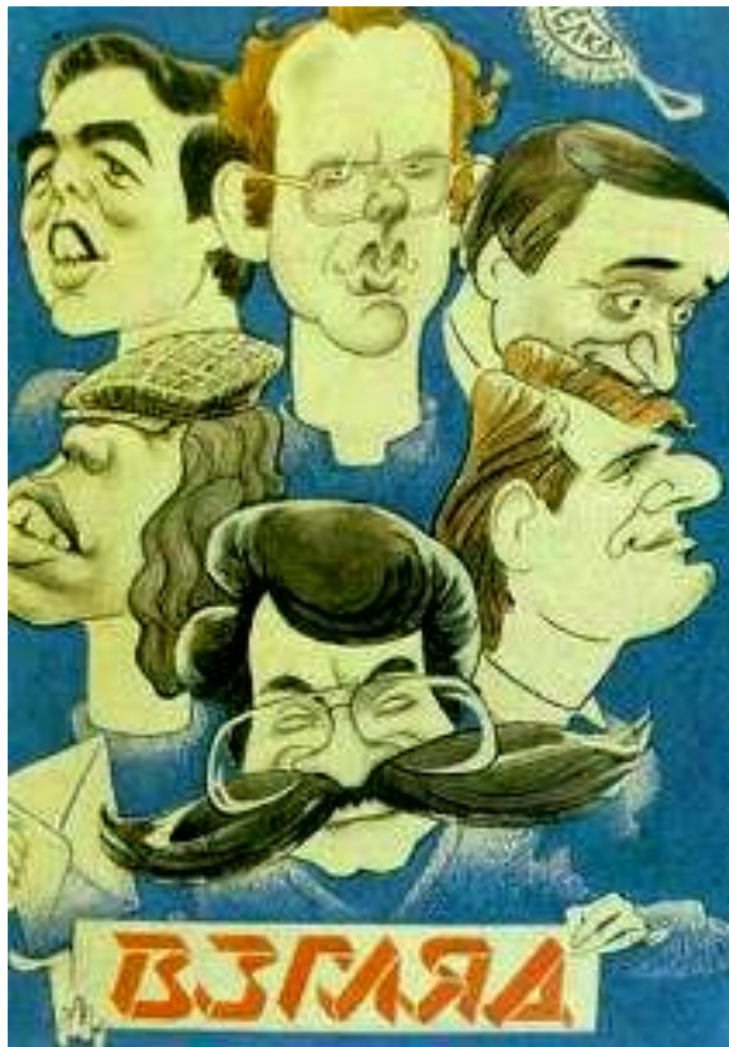
Шарж на ведущих Программы «Взгляд».

Ответ на эту статью последовал лишь через месяц, когда М.Горбачев вернулся из-за границы. После этого в СМИ критика тоталитарной системы развернулась с новой силой.