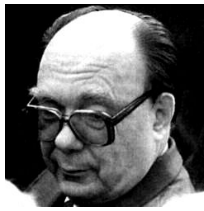
Секретарь ЦК КПСС по идеологии А.Н.Яковлев.

Гласность привела к переосмыслению прошлого. В печати были подняты «закрытые» прежде темы, критике подверглись ближайшие соратники Ленина.