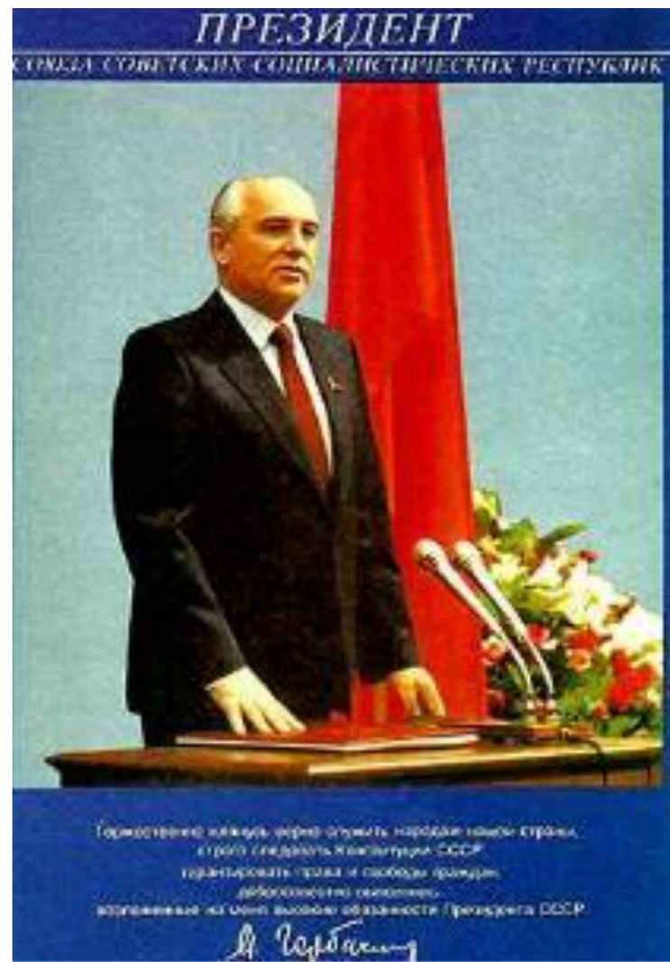
М.С.Горбачев-1-й Президент СССР.

Из рядов КПСС вышла «Демократическая платформа». Сам Горбачев став Президентом СССР, практически перестал заниматься партийными делами. Это усилило позиции консерваторов. Осенью руководство компартии РСФСР осудило перестройку и потребовало отставки Горбачева. Это привело к массовому выходу из рядов КПСС. Горбачев планировал решить проблемы на XXIX съезде осенью 1991 г. Но он не состоялся из-за путча.