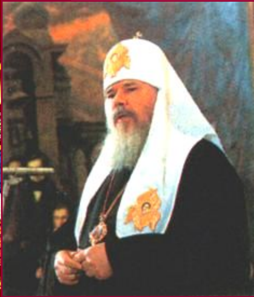
Патриарх Алексий II.

Начавшаяся демократизация общества привела к изменению отношений государства и церкви. Уже на I Съезд Советов были избраны представители церкви. После отмены 6-й статьи Конституции был отменен партийно-государственный контроль за религиозными организациями. Началось возвращение верующим культовых зданий, были сняты ограничения на церковные обряды. В 1988 г. торжественно отмечалось 1000-е Крещения Руси. В 1990 г. патриархом стал Алексий II.