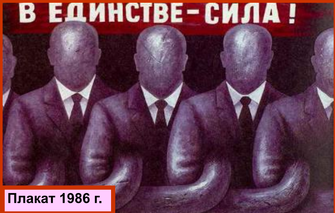
Плакат 1986 г.

В конце жизни Л.Брежневa важнейшие вопросы жизни страны решали Ю.Андропов, Д.Устинов, К.Черненко и А.Громыко.