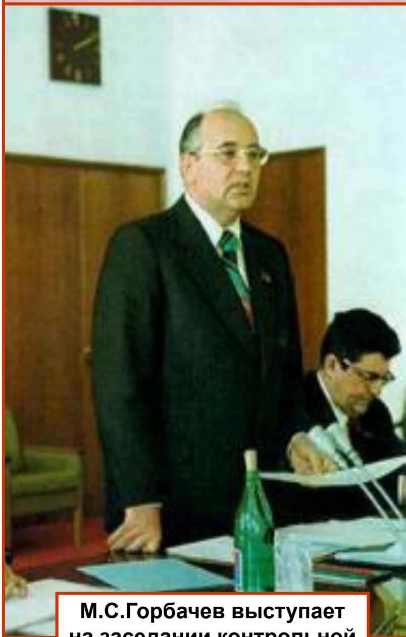
М.С.Горбачев выступает на заседании контрольной комиссии.

При Ю.В.Андропове Горбачев занимался не только сельским хозяйством, но и широком кругом вопросов как внутренней, так и внешней политики. Несмотря на сопротивление консерваторов он стал при К.У.Черненко вторым человеком в партии. Придя к власти, М.Горбачев провозгласил курс «перестройки» всех сфер жизни общества и получил всемерную поддержку, т.к. необходимость преобразований стала очевидной.