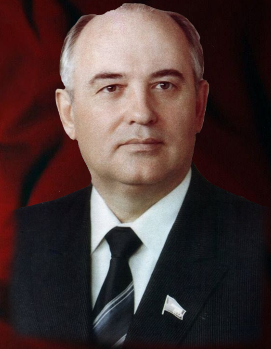
Михаил Сергеевич Горбачёв