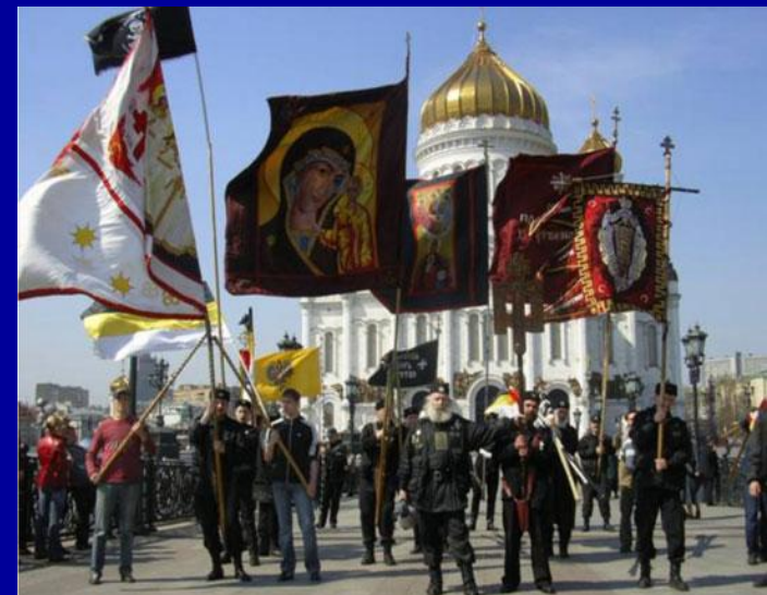
Русское национальное единство