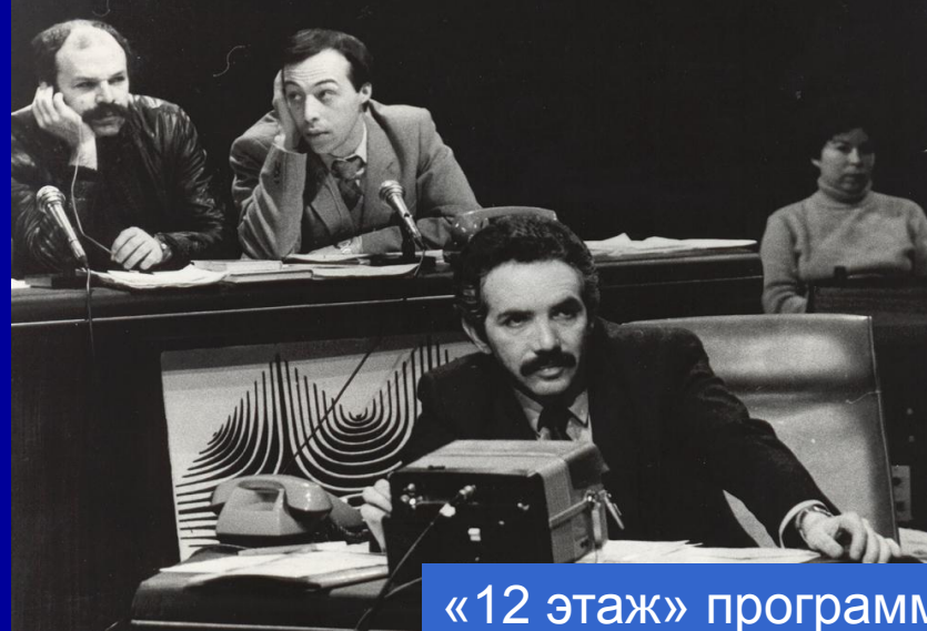
«12 этаж» программа Э. Сагалаева