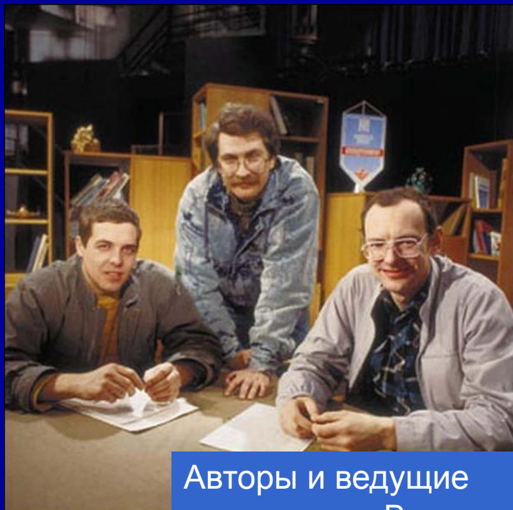
Авторы и ведущие программы «Взгляд»