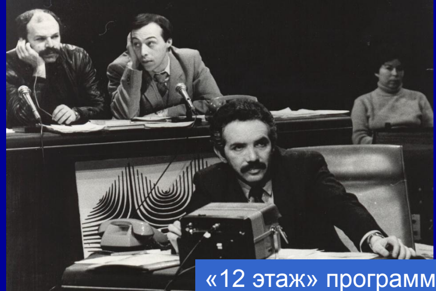
«12 этаж» программа Э. Сагалаева