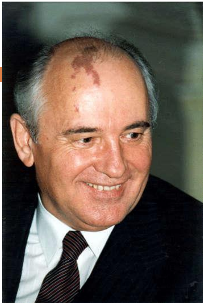
Михаил Сергеевич Горбачев

На мартовском (1985 г.) Пленуме ЦК КПСС Генеральным секретарем избран М.С. Горбачев . Он предложил курс на модернизацию советской системы, который был назван «перестройкой».