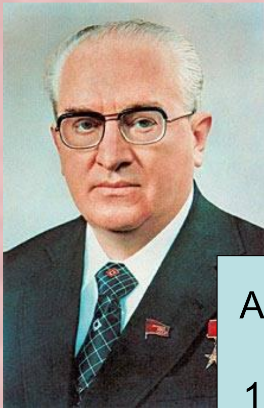
Андропов Ю. В. 1982-1984 гг.