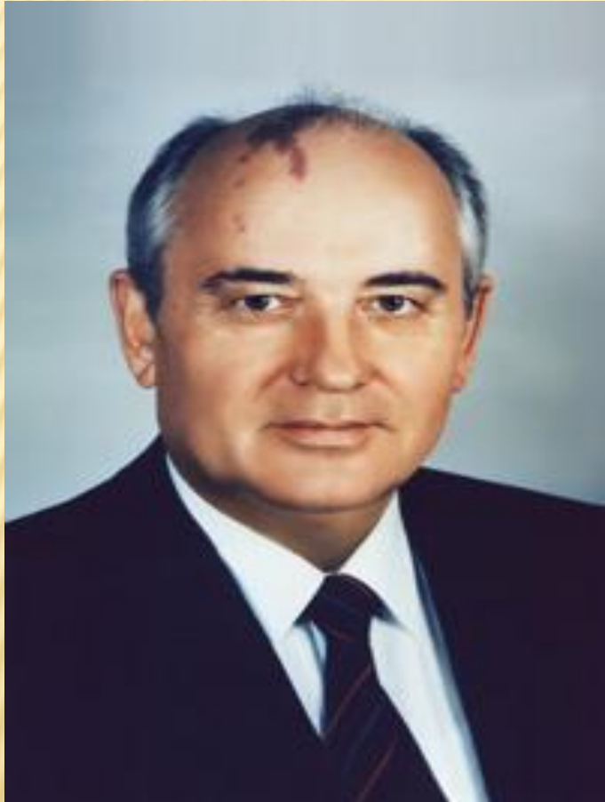
М.С.Горбачев р. в 1931г. Генеральный секретарь ЦК КПСС (с1985-1991), Председатель Верховного совета СССР (1989), Президент СССР (1990-1991)