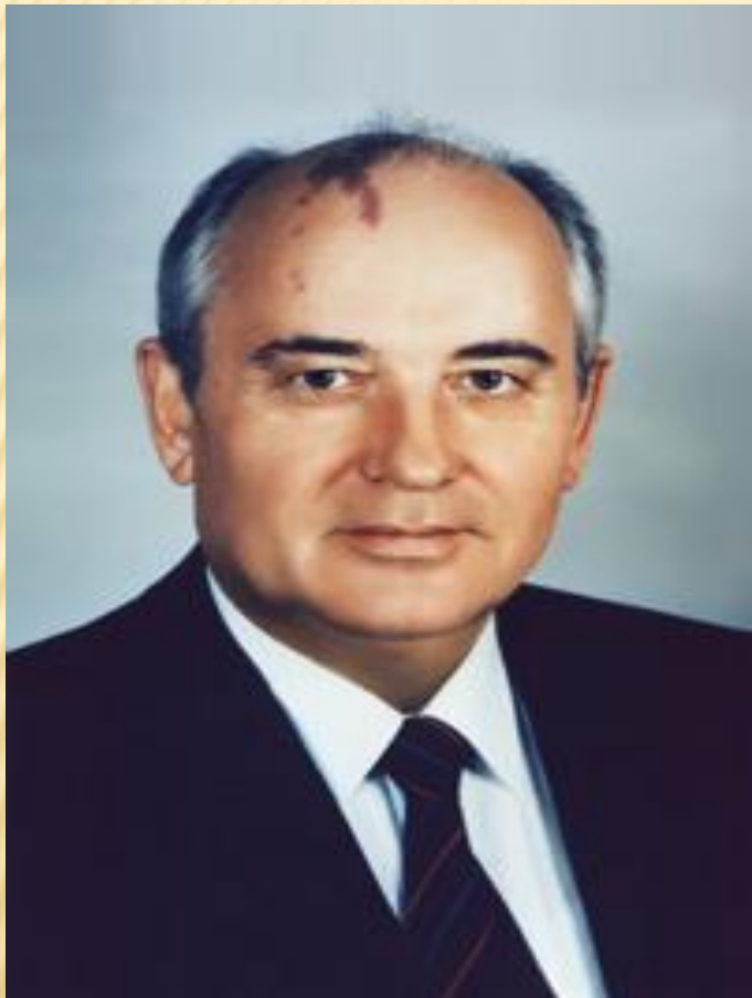
М.С.Горбачев р. в 1931г. Генеральный секретарь ЦК КПСС (с 1985-1991), Председатель Верховного совета СССР (1989), Президент СССР (1990-1991)