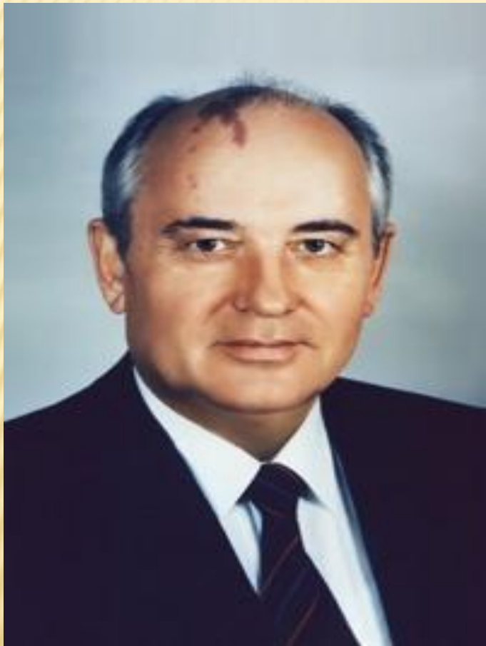
М.С.Горбачев р. в 1931г. Генеральный секретарь ЦК КПСС (с 1985-1991), Председатель Верховного совета СССР (1989), Президент СССР (1990-1991)