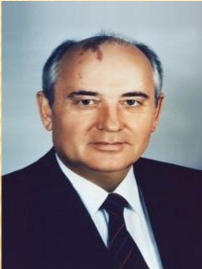
М.С.Горбачев р. в 1931г. Генеральный секретарь ЦК КПСС (с 1985-1991), Председатель Верховного совета СССР (1989), Президент СССР (1990-1991)