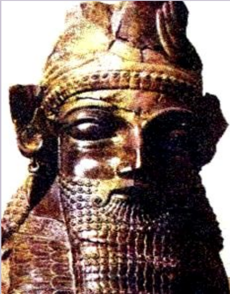
Статуя Дария I.

“Великий бог, который создал небо, землю и человека, Дария сделал царем, единым над многими царями” - говорили персидские мудрецы.