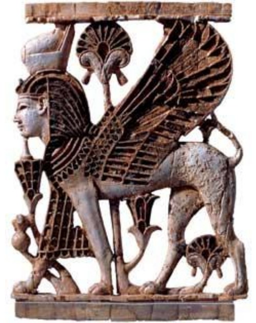
Украшение трона царя