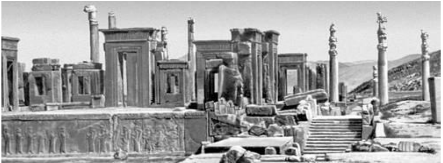
Персеполь- столица Персии