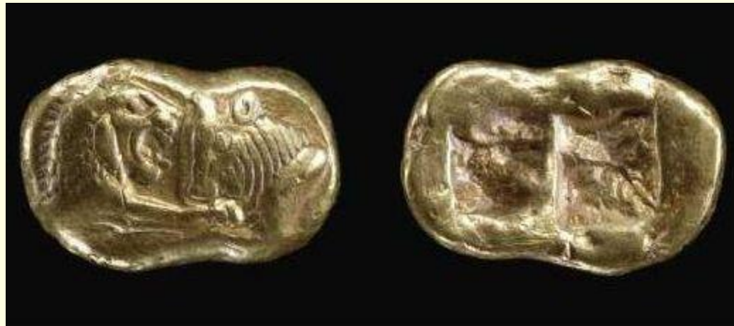
Лидийские монеты с клеймом, удостоверяющем вес. 6 в. до н. э.

В 7 в до н э здесь начали чеканить монету из сплава золота с серебром