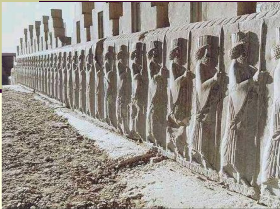
Персидские воины. Рельеф дворца Триптон в Персеполе

Автор: Куляшова И.П. Учитель истории МОУ-СОШ №3 г. Красноуфимск