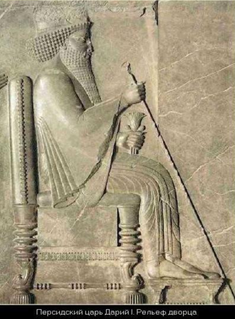
Персидский царь Дарий I. Рельеф дворца