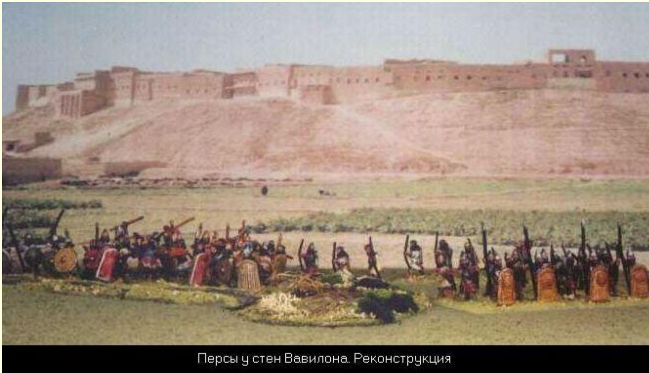
Персы у стен Вавилона. Реконструкция