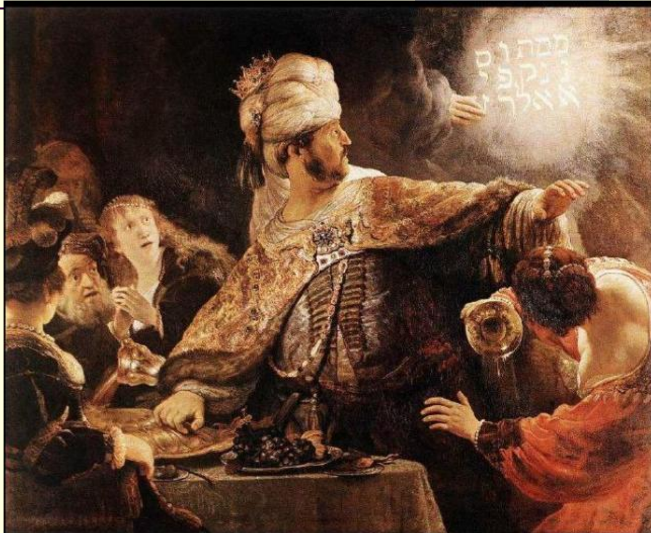
Пир Валтасара. 1635. (Рембрандт)

Как вы думаете, что означает крылатое выражение «Валтасаров пир»?