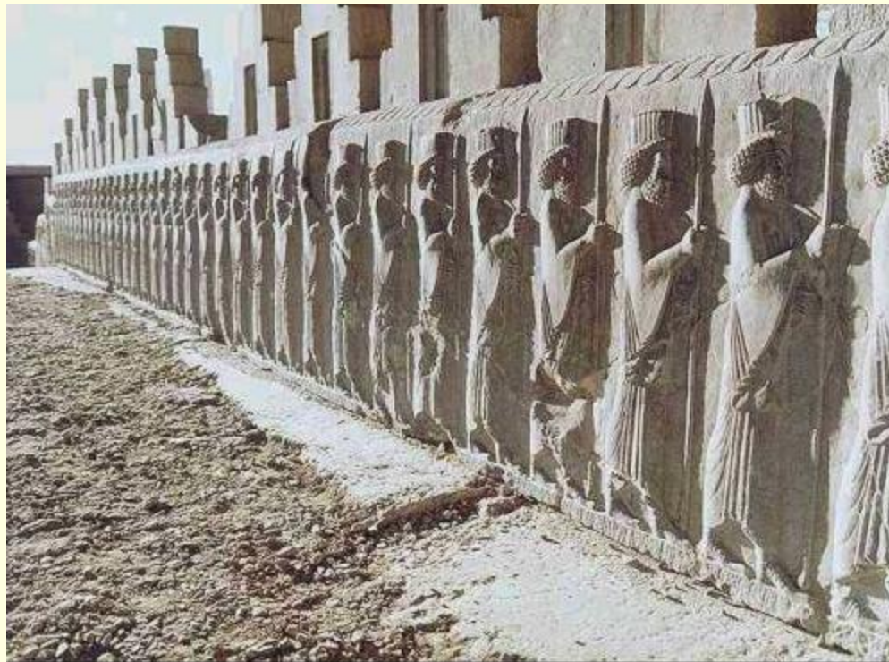
Персидские воины. Рельеф дворца Трипilon в Персеполе