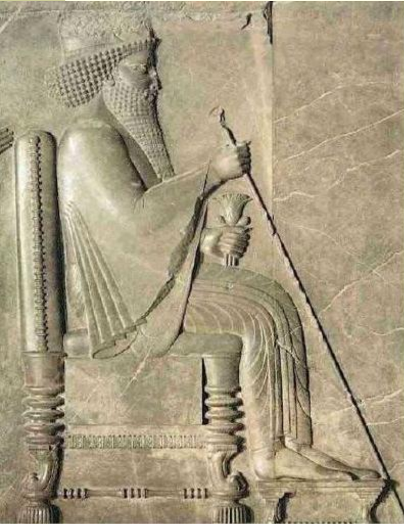
Персидский царь Дарий I. Рельеф дворца