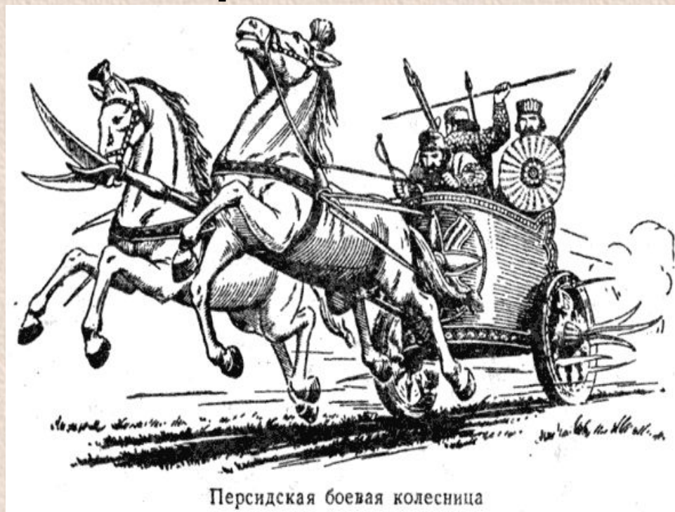
Персидская боевая колесница