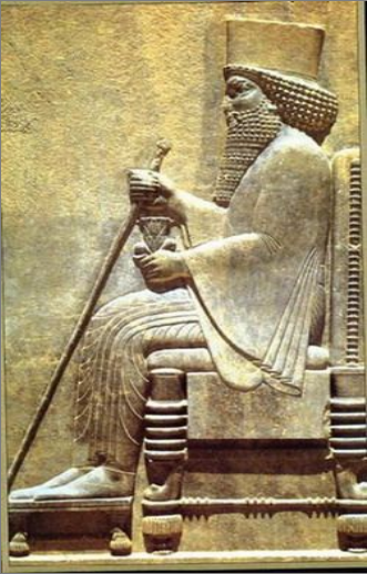
Персидский царь Дарий