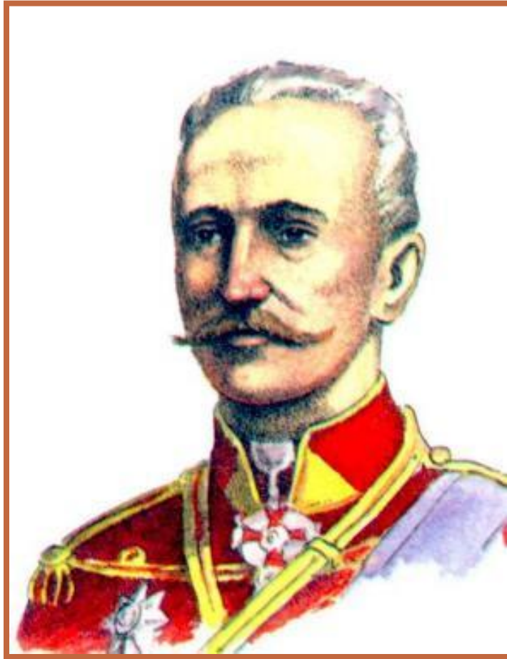
Русский генерал А.А.Брусилов

Летом 1916 г. в войне наметился перелом - Германия стала испытывать недостаток ресурсов.