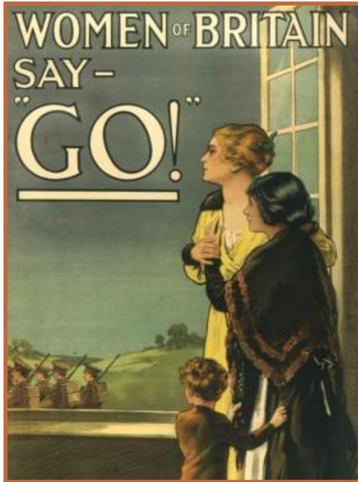
Английский плакат 1915 года

Начало войны – Усиление государственного контроля, особые полномочия правительств, ограничение прав парламентариев, запрещение национальных партий, цензура.