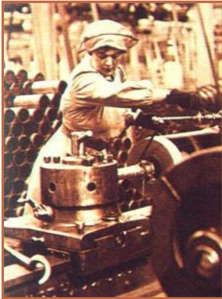
Военный завод В Англии.

Экономика воюющих стран перешла на выпуск военной продукции . Снабжение населения осуществлялось по карточкам.