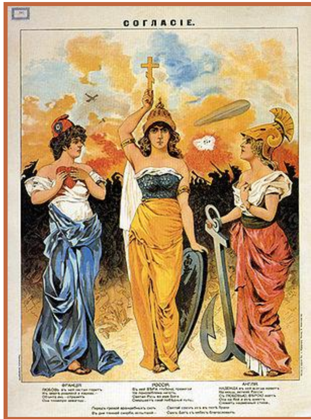
Аллегорическое изображение Антанты

Рубеж XIX-XX вв. – Тройственный союз и Антанта.