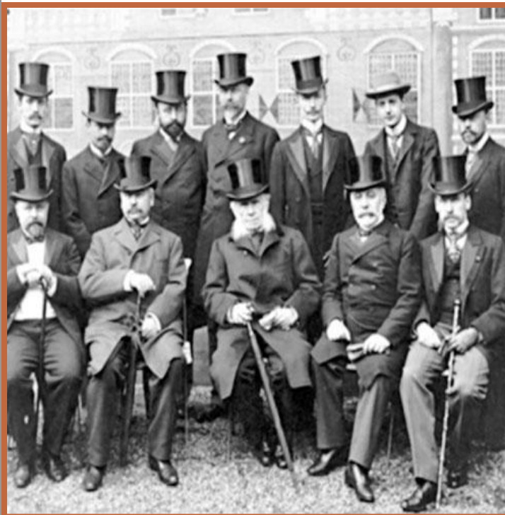
Участники Гаагской конференции

Рубеж XIX-XX вв. – индустриализация, борьба за рынки – передел мира.