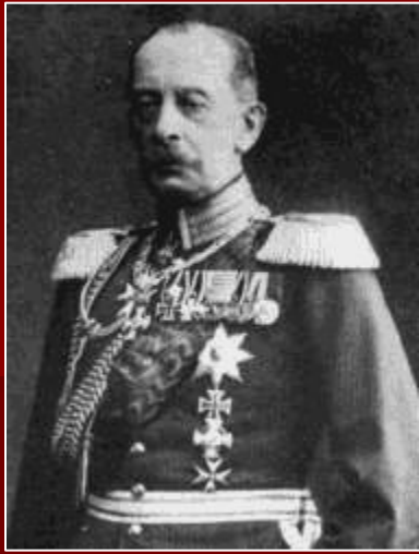
Альберт фон Шлиффен

К разработке плана немецкие военные приступили еще в 1895 году. План был построен на том, что России потребуется для мобилизации не менее 105-110 дней , а немецкой и австрийской армиям не более 14 дней . Это обеспечивало возможность нанести поражения Франции до того как Россия сумеет оказать ей существенную помощь.