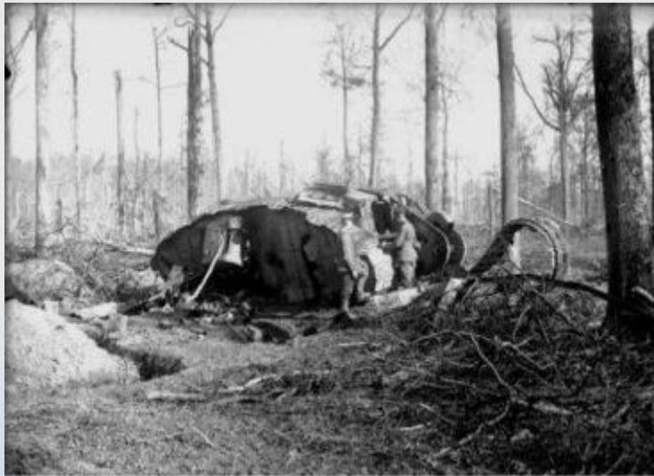
Imperial War Museum, London File: 1-Aug-1917 November - December

Однако в результате стремительной атаки пехота отстала, а танки продвинулись далеко вперёд, понеся серьёзные потери. 30 ноября 2-я германская армия совершила внезапную контратаку, отбросив силы союзников на первоначальные рубежи. Несмотря на отражение атаки, танки доказали свою эффективность в бою, а сама битва положила начало широкому применению танков и развитию противотанковой обороны.