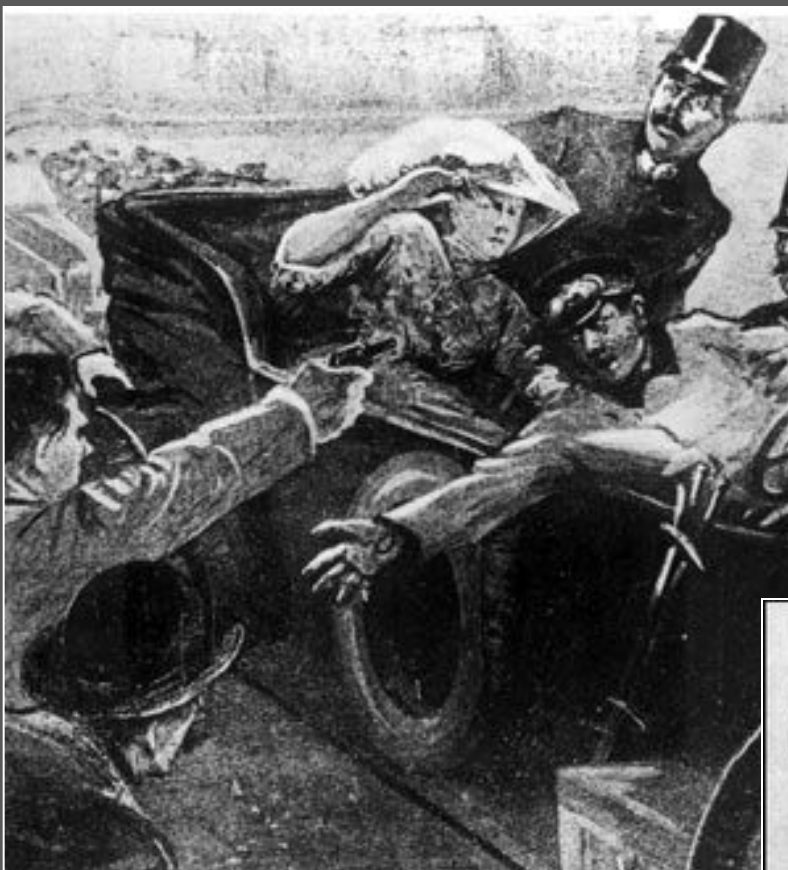
Убийство эрцгерцога Франца-Фердинанда в Сараево

28 июня 1914 года – сербский террорист убил наследника австрийского и венгерского престола Франца-Фердинанда