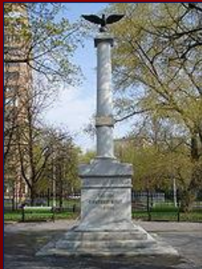
Обелиск «Павшим в Мировой войне 1914-1918