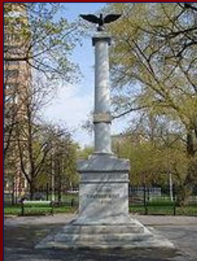
Обелиск «Павшим в Мировой войне 1914-1918