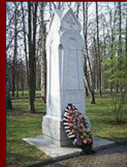
Памятник сестрам милосердия