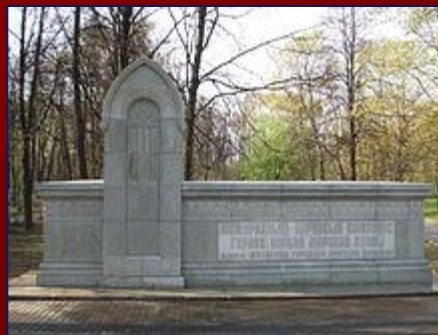
Памятный знак «Мемориально-парковый комплекс героев Первой мировой войны»