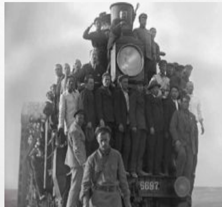
ТУРКЕСТАНО-СИБИРСКАЯ ЖЕЛЕЗНАЯ ДОРОГА (1929)