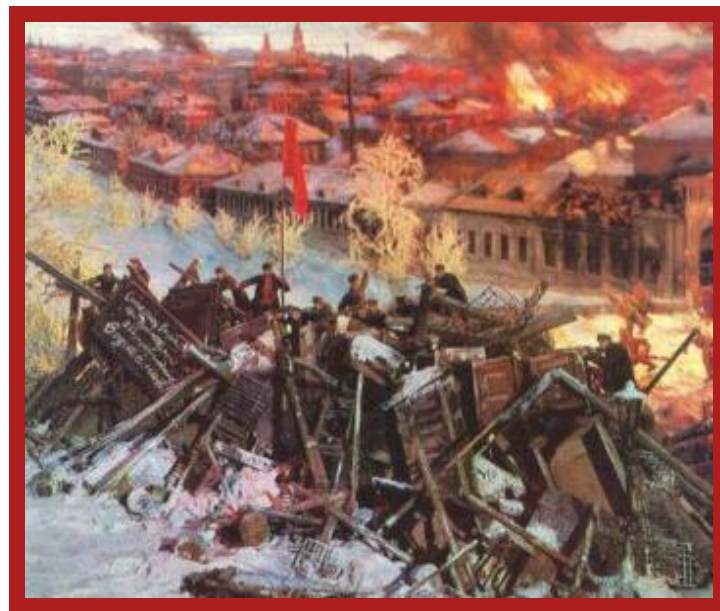
Диорама Героическая Красная Пресня.

В начале была объявлена всеобщая забастовка. Был блокирован железнодорожный узел. Москвичей поддержали рабочие Петербурга. К 10 декабря стачка переросла в вооруженное восстание. Его центром стала Пресня. На подавление восстания из Петербурга правительство прислало Семеновский полк. Восстание было локализовано в в р-не Пресни и 19 декабря Моссовет принял решение о его прекращении. По городу прокатилась волна арестов и массовых расстрелов.