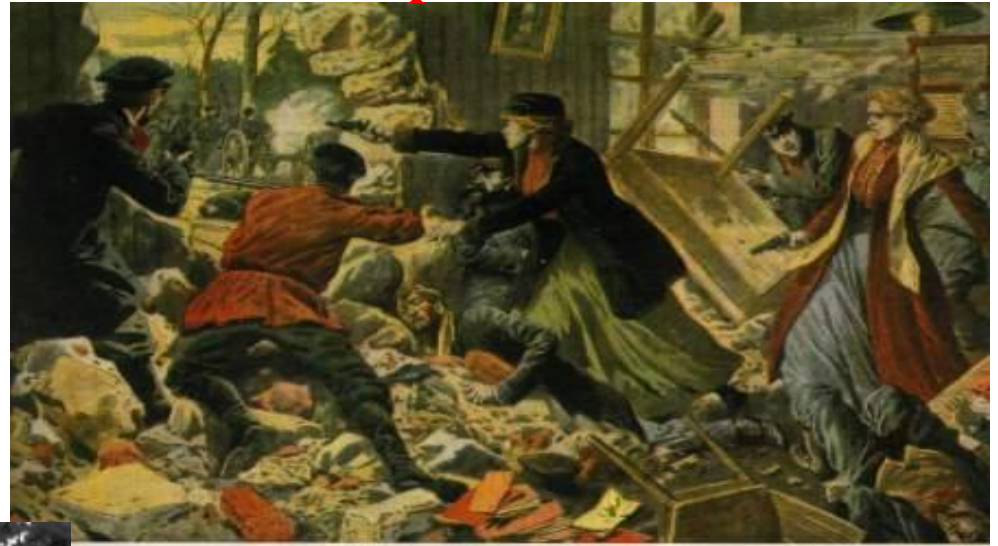
С. С. Савицкий. Повстанцы отстраниваются из развалин здания, разрушенного «залпом» («Le Petit Journal», 1905 г.).

В тот день погибло, примерно, от 150 до 200 рабочих, а ранено было около 800 человек. 9 января было прозвано «кровавым воскресеньем». События этого дня потрясли всю страну. Портреты царя, которые ранее почитали, теперь стали рвать и топтать.